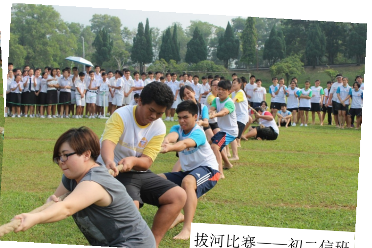
拔河比赛——初二信班