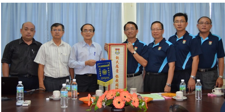
(上图) 吉打新民独中代表团

在今年的4月至6月短短三个月之间，便有来自太平华联独中、金宝培元独中、江沙崇华独中、安顺三民独中、班台育青中学、居銮中华中学、巴生中华独中以及吉打新民独中组团前来我校考察，证明成功教育模式已开始获得各地独中关注。