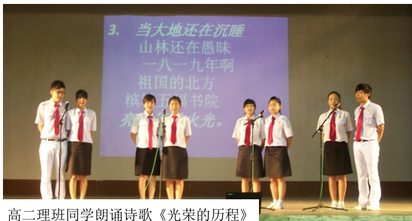
高二理班同学朗诵诗歌《光荣的历程》

另外，我校华文学会的会员和高二理班的同学也在纪念活动上分别朗诵诗歌《独中颂》和《光荣的历程》，合唱团的团员则表演大合唱《跨世纪的新一代》和《万年红》。