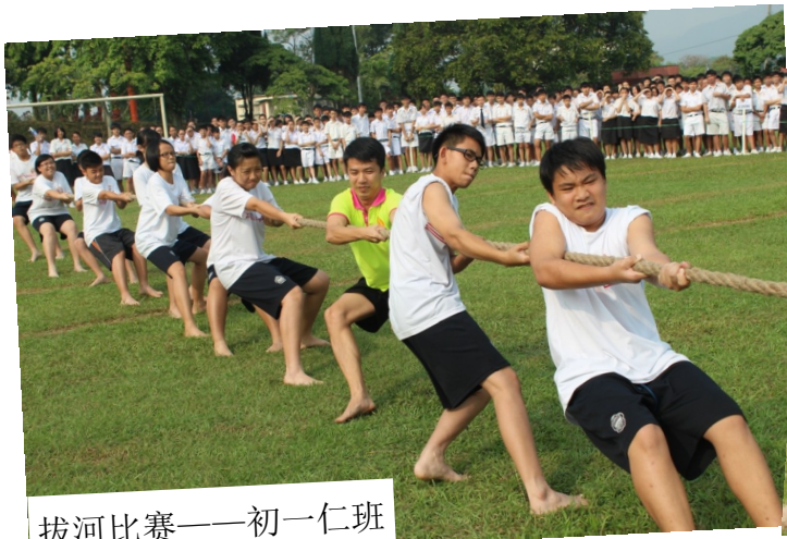
拔河比赛——初一仁班