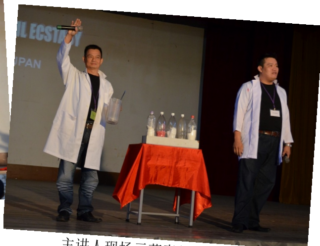
主讲人现场示范毒品制作过程