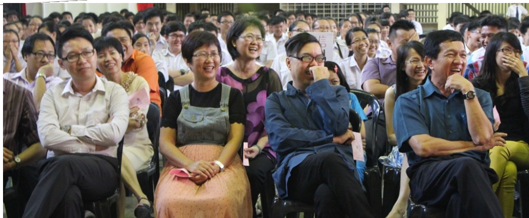
究竟是什么表演让老师们笑得合不拢嘴？