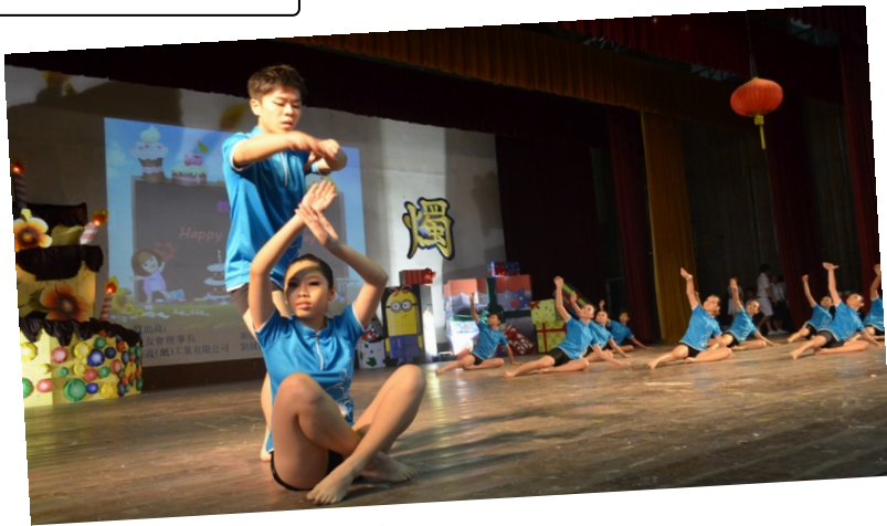
舞蹈团呈献舞蹈“归鸿”