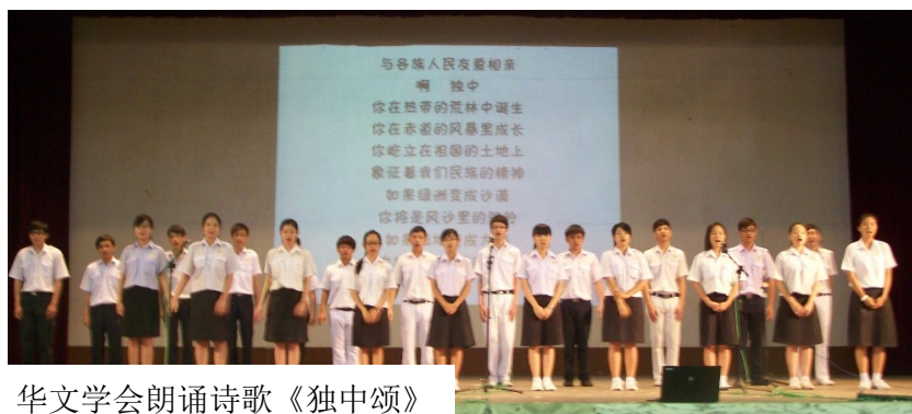
华文学会朗诵诗歌《独中颂》