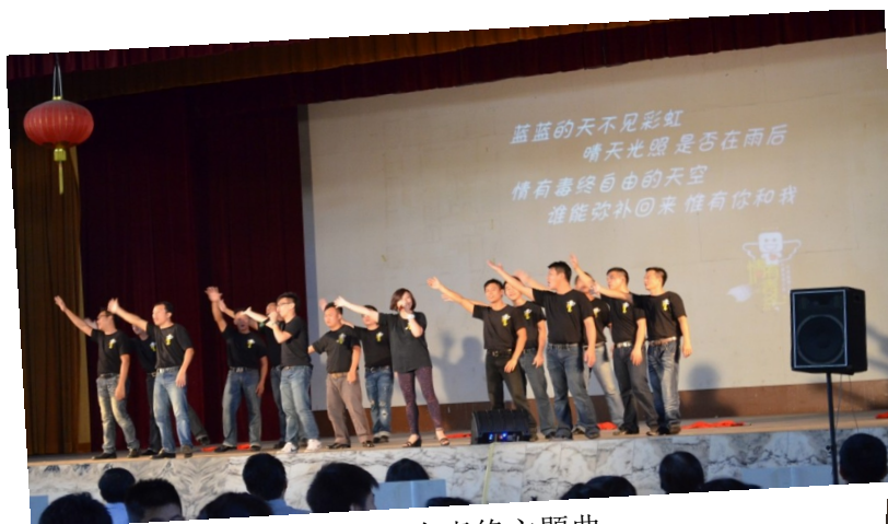
演唱情有毒终主题曲

由雪兰莪恩典青年中心主办的“情有毒终”巡回反毒运动日前来到我校举行，该中心以话剧、相声、歌舞、影片、现身说法等方式向同学们表达了毒品对青少年以及社会家庭所带来的危害。同时，他们也在活动结束后售卖主题纪念T恤及钥匙圈，并获得全校同学们的踊跃支持。