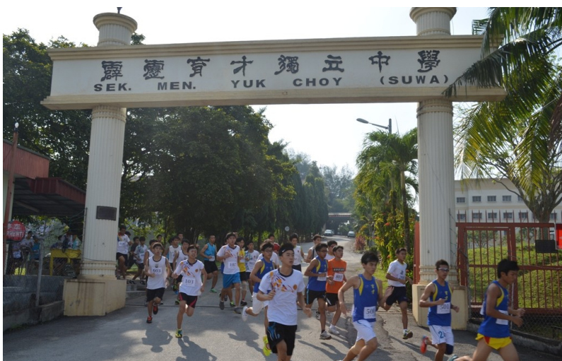
健儿们奋力勇往直前，希望为各自的学校“跑”出好成绩