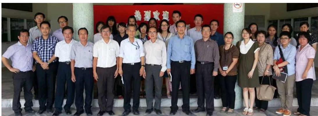
(左图) 太平华联独中、金宝培元独中、江沙崇华独中、安顺三民独中、班台育青中学代表团

他表示，经过近3年的推行，从初步接洽、增进了解、探讨落实到试验推行，已取得相当成果，目前正尝试走出怡保，扩大到霹靂州其他独中，让更多独中的老师和学生受惠。他也说，近年来来自南马柔佛，甚至东马砂拉越的独中，也相继到我校考察，为日后推行成功教育作参考和准备。