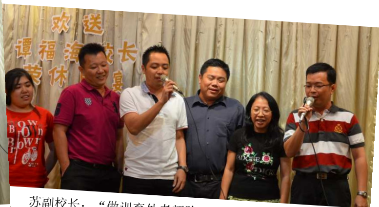
苏副校长：“做训育处老师除了要会训话，还要会唱歌”