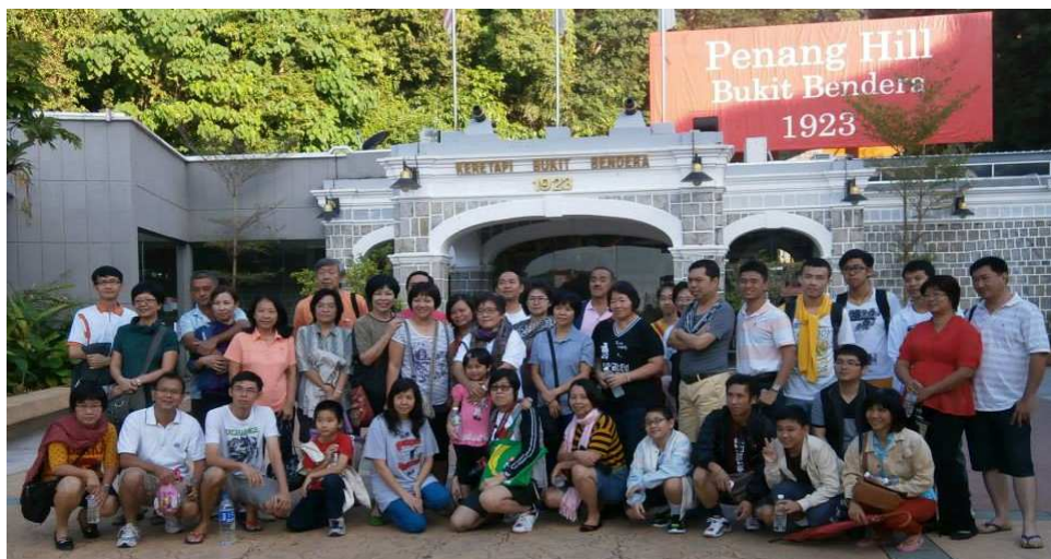
上图：老师们乘搭最早一趟的缆车升旗山观赏日出以及呼吸高山的新鲜空气

另外，来到槟城自然不能少了品尝当地的美食。老师们也趁机品尝了道地的娘惹餐、槟城著名