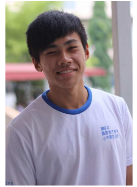
古骏业·生活营总务

从这次的活动中体验到合作的重要性，大家必须具备充分的合作精神，才能顺利将工作做好。