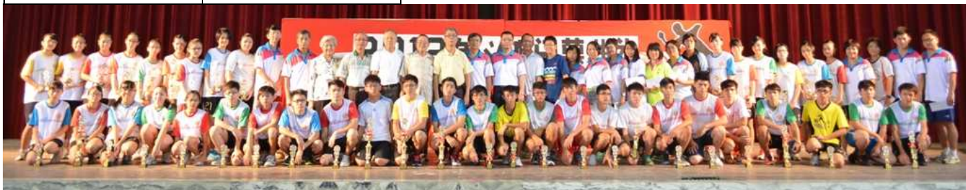
全体董事与得奖者合照