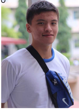
林凯文·生活营总务

营会的筹备工作很有挑战性，但在过程中学习到很多宝贵的经验，包括活动能成功有赖各单位的全力配合。