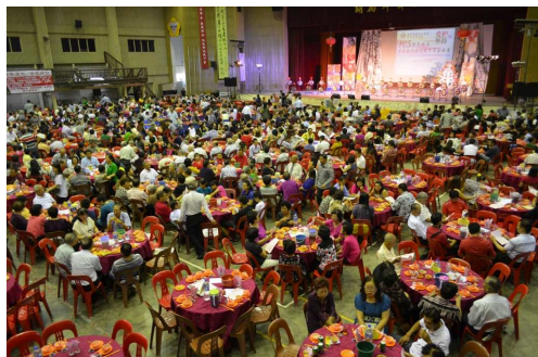
左图：晚宴共开150席，座无虚席。

今年校庆主题是爱护与坚持，育才独中能走到如今，依靠的不只是董教总及各方，是依靠广大的华人社会，出钱出力的成果。华人社会对华文教育这么执着坚持，是因为几千年的华人传统文化蕴藏在我们的语文和文字里。“只有通过本身民族的语文，才能真正认识和吸收它的精神和精华；若用别族的语文来学习和传承华族中华文化，就如隔靴搔痒，无法准确传达其中的讯息。”政府推行《2013-2025教育发展蓝图》，其中有不少措施非常不利华文教育。“面对不利华文教育的措施，华社须要团结一致反对，以维护民族教育于不灭；因为教育就是希望，只有办好教育，我们的民族在这个国家才有希望。”另外，筹募的1000万令吉基金，母金将存放在银行，动用所得利息，用以提升教职员水平、提高教育素质、为家境清贫学生和毕业生提供奖学金或贷学金，与其他促进校务的计划。