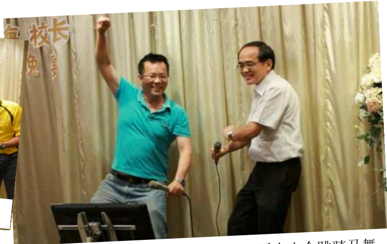
Op~op~oppa~~平常一脸正经的校长原来也会跳骑马舞