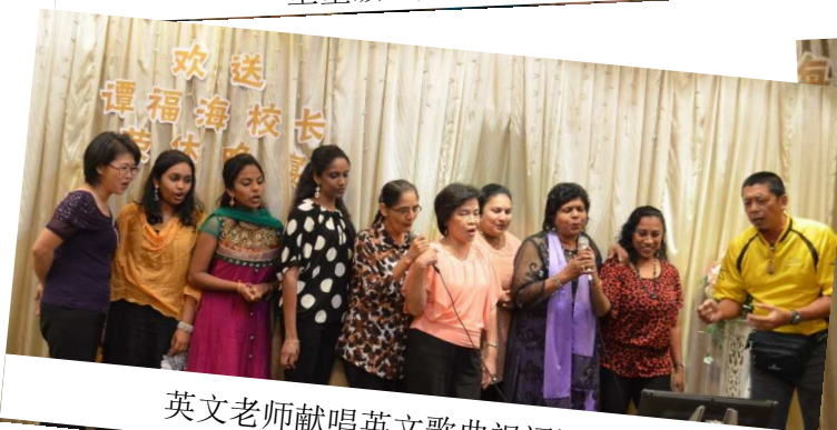
英文老师献唱英文歌曲祝福谭校长