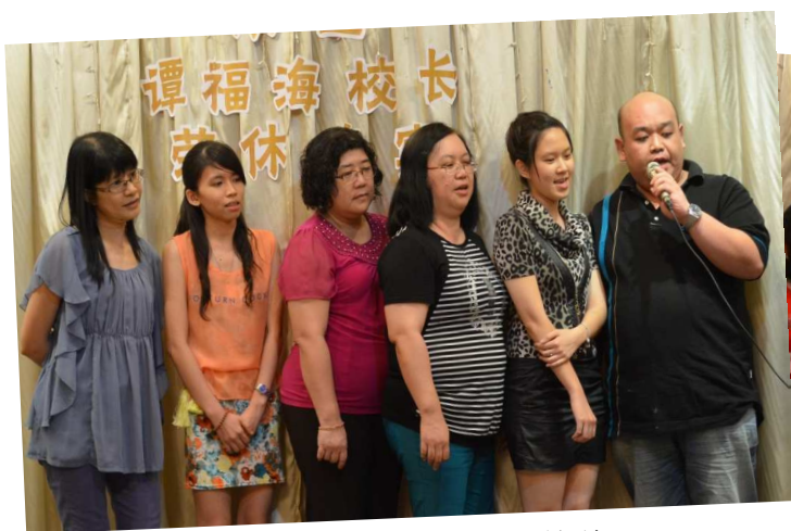
“重量级”人物为校长献唱