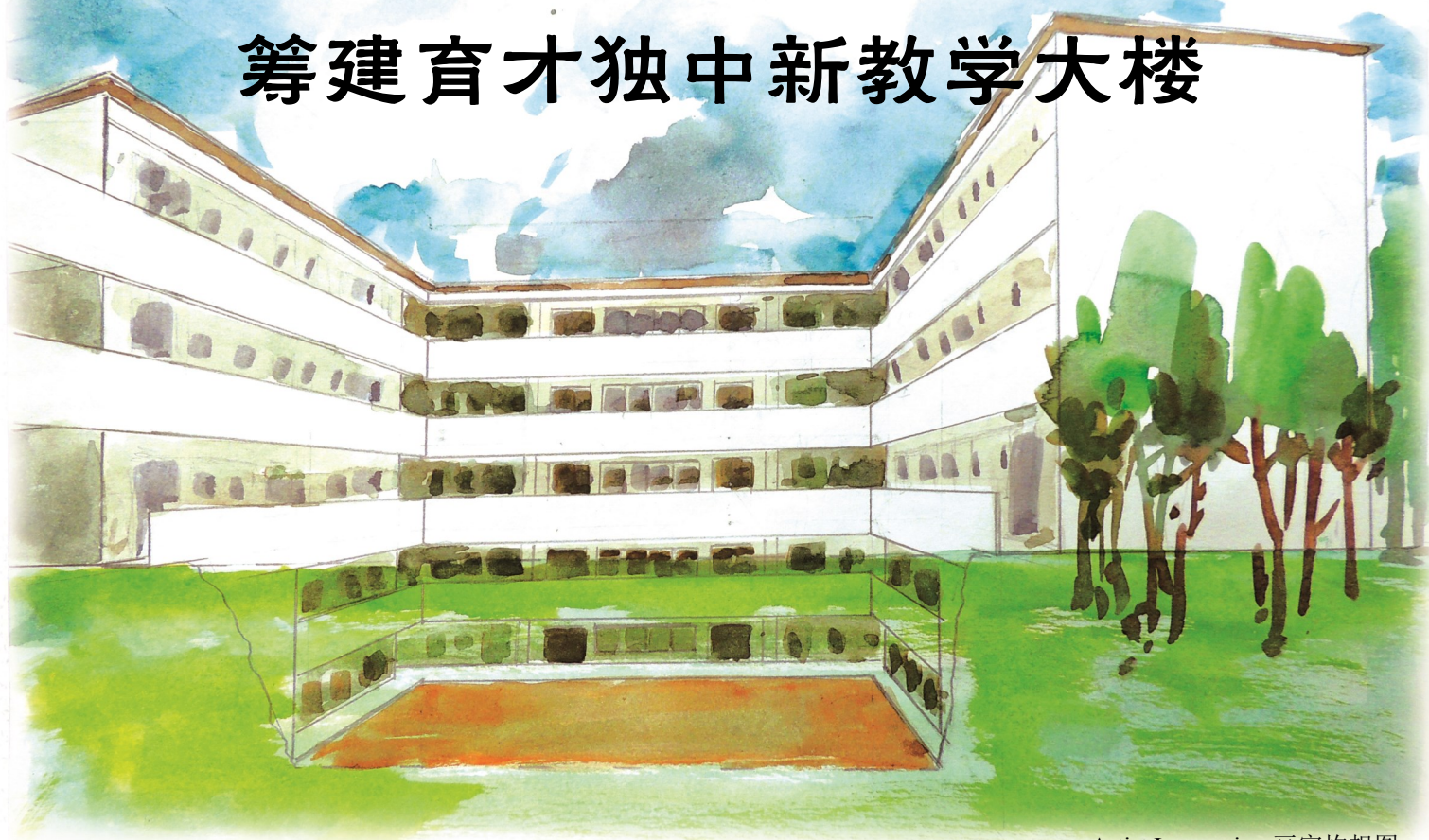
Artist Impression 画家构想图