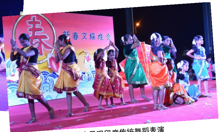
来自淡米尔小学的学生呈现印度传统舞蹈表演