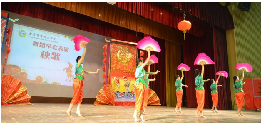
本校舞蹈工作群表演扇子舞“秧歌”