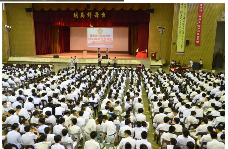
(下图) 300多名新生出席开学典礼，场面热闹。