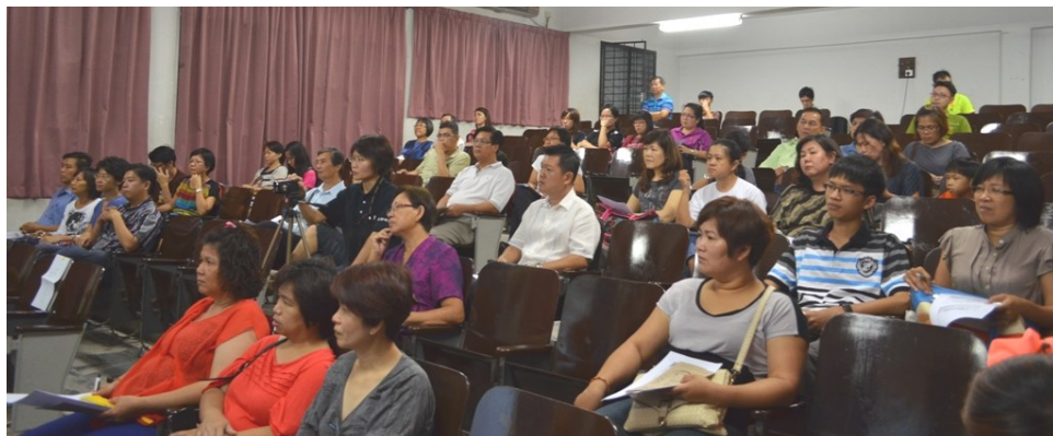
秦启庚副教授的《家长和孩子共同成长》讲座获得不少家长的踊跃支持

配合董总成立60周年，我校与董总联办了两场德育讲座，并邀得中国华东师范大学心理与认知科学秦启庚副教授前来为教师以及家长探讨教育孩子的课题，获得家长与教师的热烈欢迎。秦副教授说，家庭教育的艺术不在于传授本领，而是对于孩子的激励、鼓舞和唤醒。