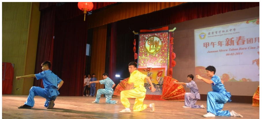
本校武术团呈献武术表演