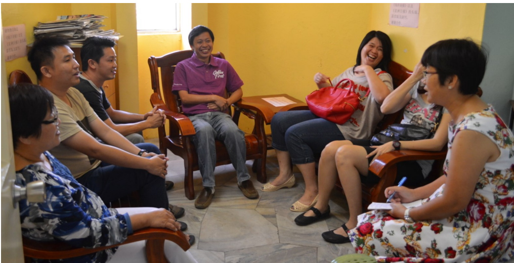
(左图) 回校拜访的校友与老师们谈笑风生