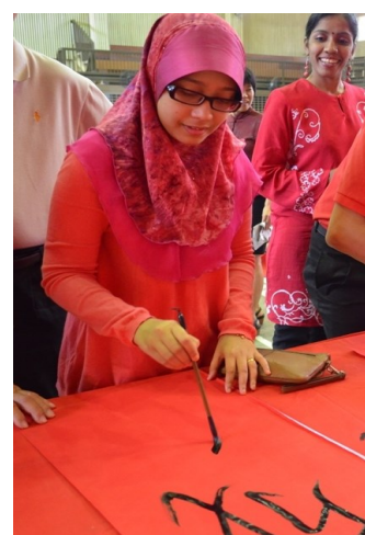
友族老师也来参与挥毫