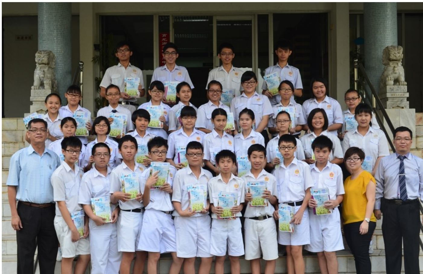
获得参与该阅读计划的同学兴奋地与师长在图书馆前合照，右一及右二为苏民胜校长以及辅导主任吴鄢如老师，左一为谢志明副校长。

有关赠书活动是在我校李莱生图书馆进行，校长苏民胜表示，此计划能帮助学生培养阅读的兴趣，他也劝勉学生应该及早培养起喜爱阅读的习惯，并慢慢发掘阅读的好处。