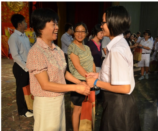
老师接过同学送上的礼袋，喜上眉梢。

感恩老师的心未必只局限在教师节才能表达，新年同样也能向老师感恩，感谢老师孜孜不倦的教导。配合余仁生有限公司发起的“春节谢师恩”活动，我校也是受惠的学校之一，教职员们都获得一份由余仁生有限公司赞助的礼袋，并由同学们亲自交到老师的手中，充分体现感恩老师的精神。