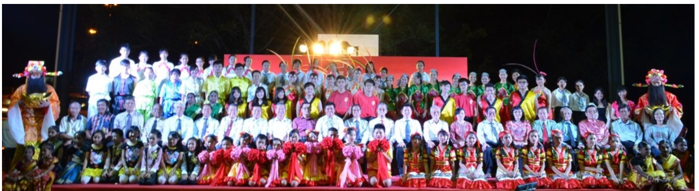
全体工委以及工作人员一同向九洞区的居民拜年