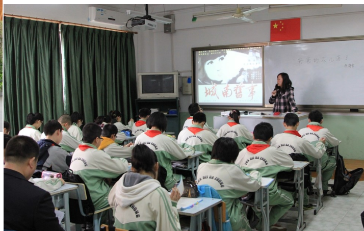
（下图）闸北中学上课情况与教学设备