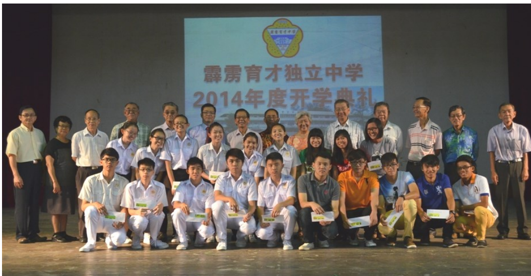
(上图) 校方颁发奖励予2013年统考中考获优良成绩的学生。

副董事长陈汉水则强调，育才为了传承中华文化，坚持不采用双轨教学制度，避免学校变质。他也呼吁热爱华教人士要坚决反对不利于华教发展的《教育大蓝图》。