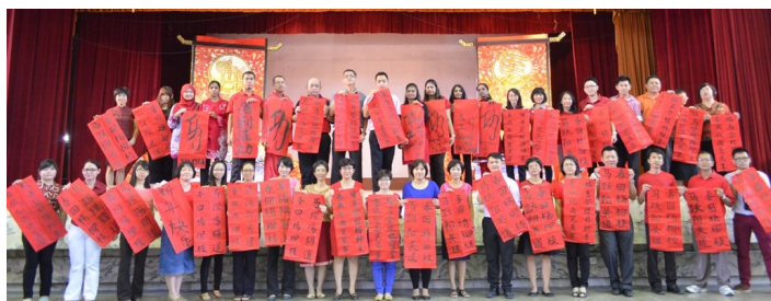
(上、下图) 全体老师以及董事祝愿各界“马到成功”