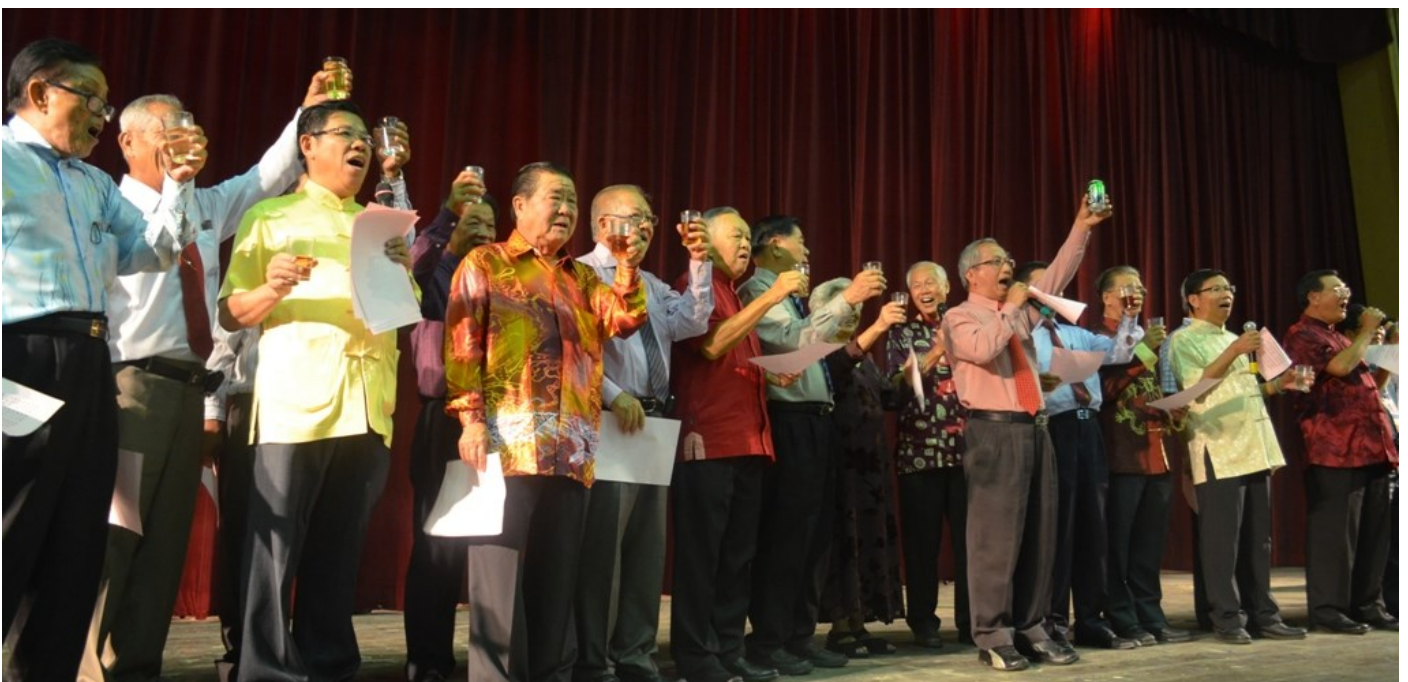
(上图) 全体董事和嘉宾上台向出席团拜的人士敬茶和敬酒