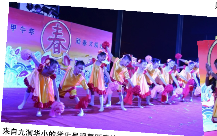
来自九洞华小的学生呈现舞蹈表演