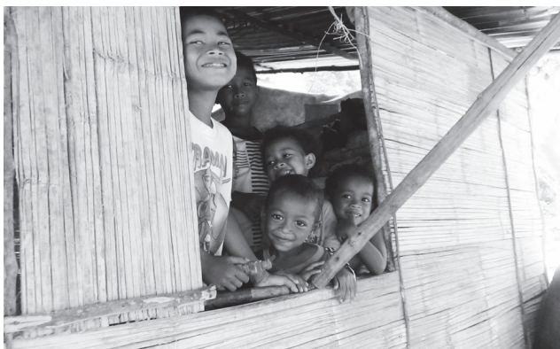
参观原住民的居所，让学生产生“身在福中不知福”的感悟。