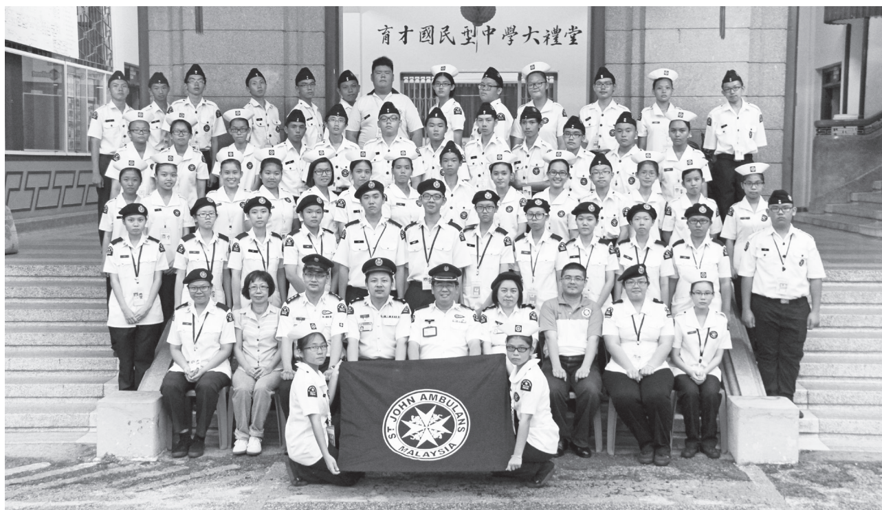
本校与育才国中的圣约翰救护队合影。