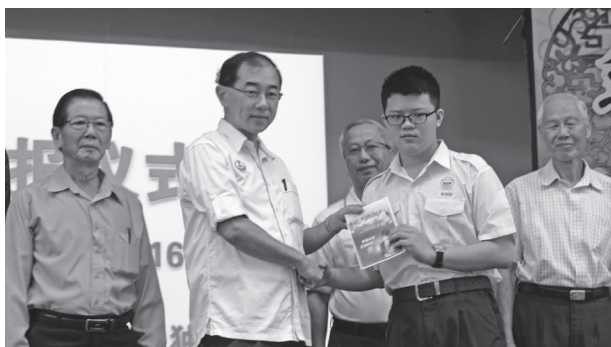
霹雳州行政议员拿督马汉顺赠送电子报给同学。

星洲日报学生阅报计划是由教育部主催，星洲日报主办。霹雳州行政议员拿督马汉顺赞助今年星洲日报学生阅报计划下的“教育布施”赠报计划，星洲日报也以1份对赞助人2份的方式，赞助这项计划，让本校各班考获前3名的学生受益。