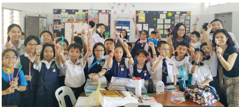
文美班学生在老师带领下到育才华小进行“海马吸管”制作教学。