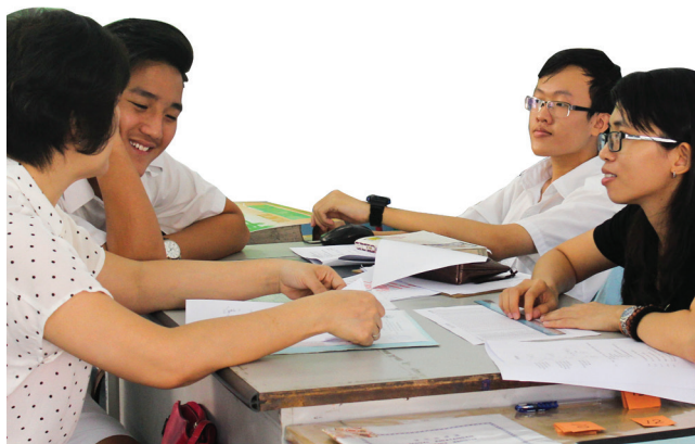
班导师（右）与学生家长会面，共同了解孩子的学习情况。

为了加强校方与家长之间的联系，让家长能够更好地了解孩子在学校的学习、生活情况以及提高学生在学习上的成效，本校于6月25日举办了“2016年家长日”，让家长亲临学校与班主任及科任进行面谈，以了解孩子在校内的课业状况以及领取上半年的成绩报告。