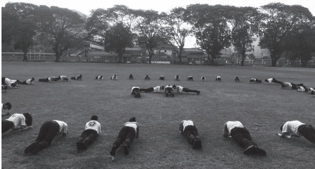
体力的训练，让大家深感吃不消，但也是进行了一次又一次的突破。