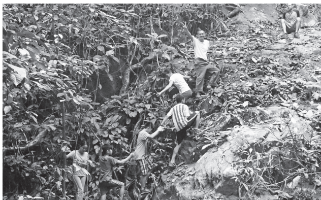
有趣又刺激的森林徒步活动，让同学忘了耕作的痛苦。