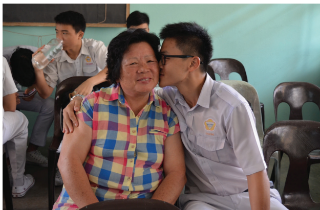
除了双亲节，家长日也是孩子向家长表达爱的时刻。