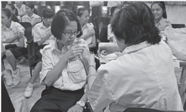
本校辅导处安排有需要的学生施打B型肝炎预防针。