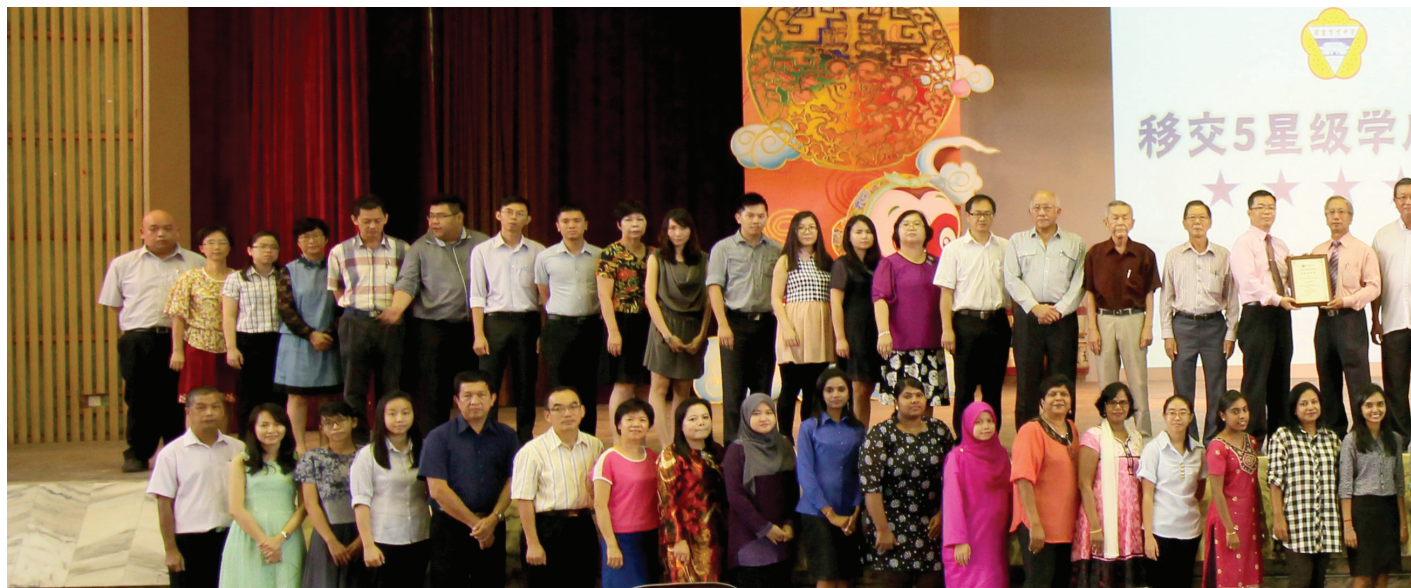
获得“五星级卓越学校”，全体董教人员高兴合照。

教育部为了确保全国私立学校能达到其设定的教育条例，会进行“私立学府标准高素质评估”（SKIPS），这是教育部针对全国私立学校在行政管理架构、课程目标、环境设备、校内外学术考试成绩、校风及学风等方面进行的综合性评估，而达到评估标准的学校将冠上星级级别（star-rating）。本校在这一项评估中，获得了最高荣誉——5星级！这表示本校2015年在教学、管理、考试、学生健康、学生纪律、学业表现、课外活动表现、卫生等方面都有标青的表现。