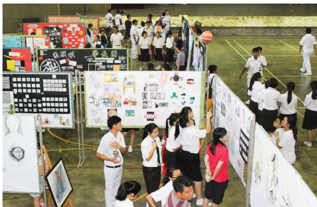
学生及家长在空余时间，到杨金殿礼堂欣赏美术作品及参观学会活动展览。