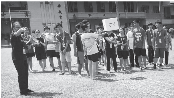
破冰游戏，使大家解除了初见面的尴尬感觉。

这是很不错的活动，同学们虽然有老师的陪伴，但也懂得自动自发的完成各项任务，这是值得欣慰的。参与这个生活营后，同学们在操步的表现方面变得更整齐更理想了，纪律方面也大有提升，一些委员也更加有责任感，甚至平日没什么互动的同学们，回来后交流也多了。