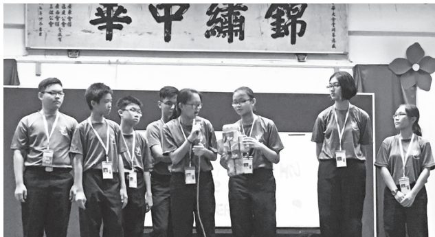
上台表演，也是考验默契与团结的一环。

我觉得非常荣幸能够参加这一次的圣约翰救伤队交流营，这三天时间很急促，转眼间就过去了，但是在这段时间里，我经历了一些永远不会忘记的事，从中有很大的收获。第一，我学会了服从，因为身为纪律团体，服从是每个团员都必须做到的基本要求，我在之前是完全不会服从命令的，但在交流营内若不服从命令最终得到的是惩罚。第二，既然名为交流营便是两校队员的交流，我也因此结识了不少国中的队员朋友，使我狭小的社交圈得以扩大。最后，此次的交流营也让我见识到我校与育才国中的圣约翰救伤队之间的差别，无论是在纪律方面或是在操步方面。我观察到育才国中的圣约翰队员对前辈和导师抱持尊敬的态度，每个队员在步操上都有稳固的基础。这是我们要学习的。