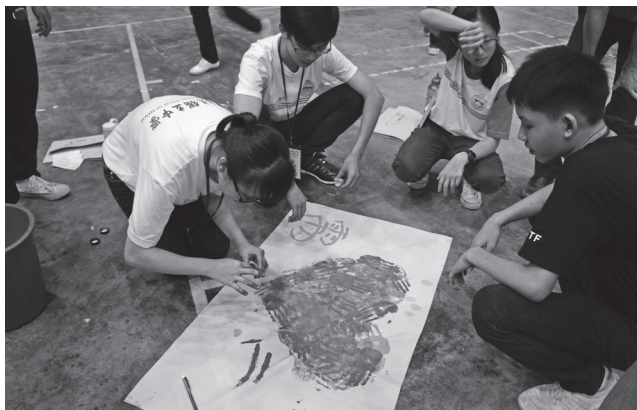
分组并绘制组旗，让原本陌生的营员们彼此熟悉。

一名好的领导应该要积极参与活动并全心全意投入其中，同时也服从团体和老师的指示。在带领组员们进行活动时我得到不少宝贵的经验，让我感到十分高兴。