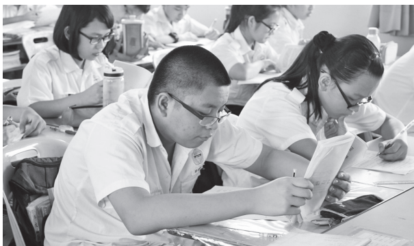
同学们正埋头作答华教常识题。