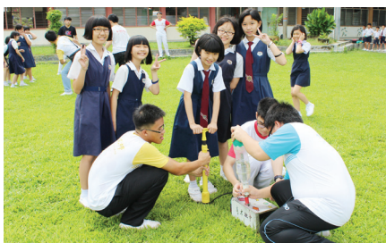
育才独中学生（白衣者）同心协力将有有趣的科学实验带给小学生。