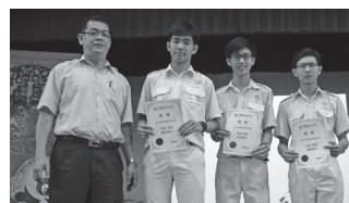
乙组得奖者与副校长合照。