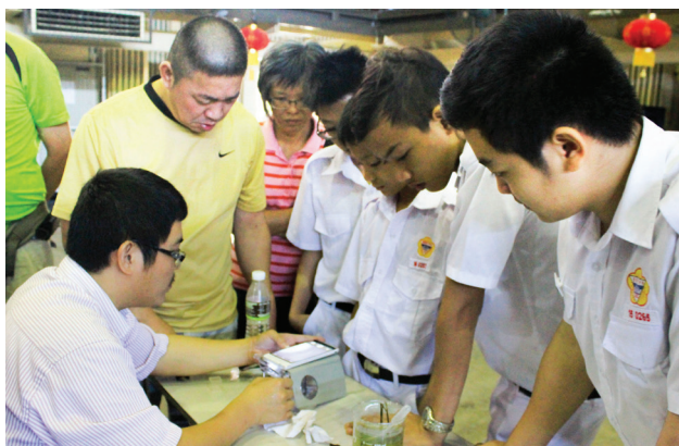
神秘且有趣的科学实验吸引了家长和学生的目光。