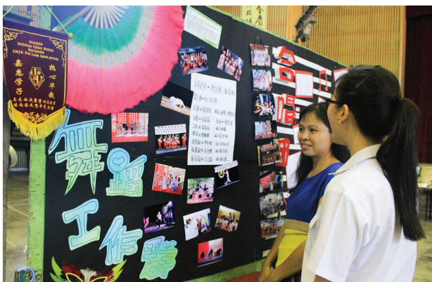
家长参观学会活动成果展，更清楚孩子在学校的学习生活。