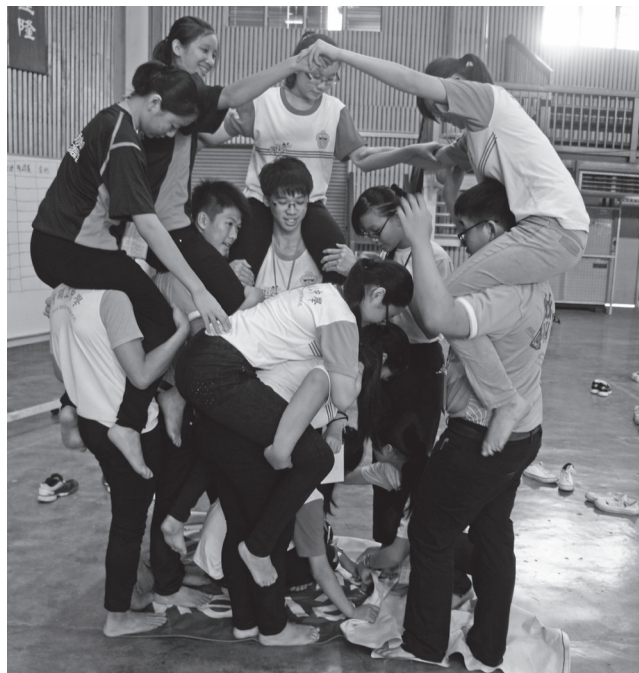
营会准备了多种活动，让营员们动脑筋并了解互相合作、沟通的重要性。