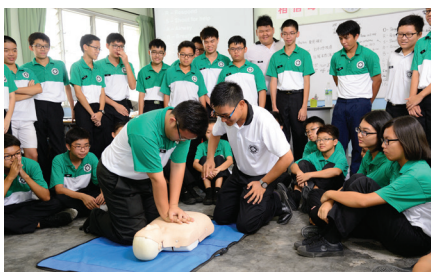
圣约翰救护队的团员认真学习急救知识。