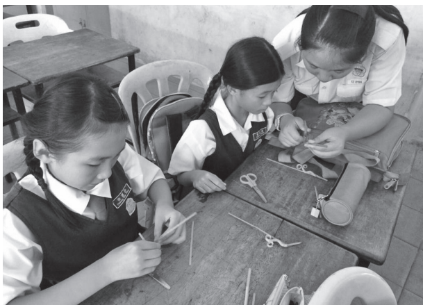
本校学生（右）耐心教导小学生们制作海马吸管。