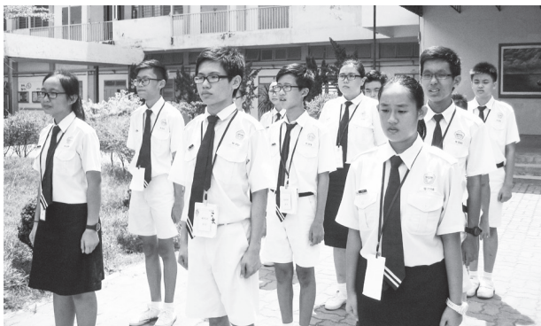
学长们不惧酷热的天气，认真操步。

到了第三天，大家集合到讲堂观赏影片及进行颁奖活动，营会设了：最佳男营员、最佳女营员、最佳组合等等奖项以奖励学长们这几天的努力付出。