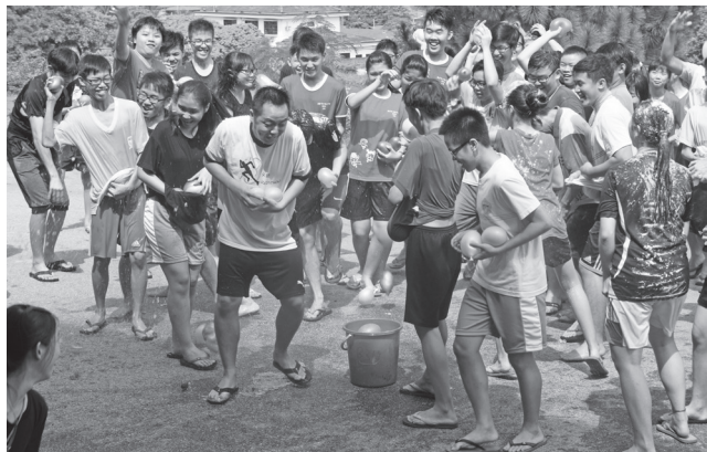
营员们欢乐的投入与活动中，希望能将学到的知识带回各自的学会团体中。