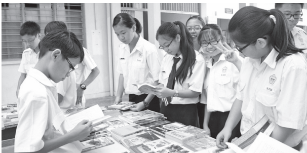
图书馆通过“晒书日”活动让同学们对世界书香日有更多的认识。

图书馆在晒书日出售的新颖二手书，对我来说是很好的活动，因为平常有阅读的习惯，加上一本书才1令吉，所以在这里找到了文学及历史类书籍，有所斩获。