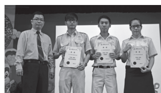
甲组得奖者与校长合照。