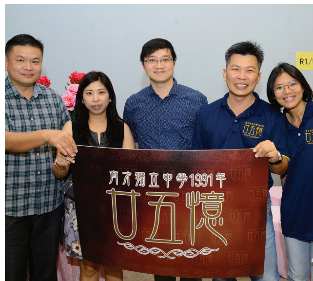
1991年毕业的校友，25年后再度相聚。

同学们，不管今天你认为自己处在什么位置，希望我们之间不要做一些不必要的比较，回到同学之间我们就是同学，就是当年的你和我，没有所谓的高低和距离！有成就者当学习谦卑，去照顾弱势；还在奋斗者当继续努力，不要放弃梦想！做对的事，有过错的及时回头；我们无时无刻都还要学习做人，继续成长，希望同学聚会能提供我们互相支持的力量！