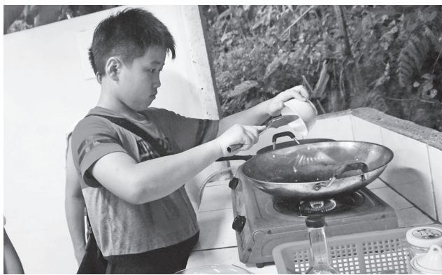
自己准备食物是活动之一，对学生来说是有趣的新体验。