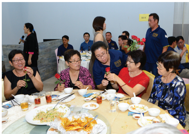
廿五忆聚会的筹委还准备了红玫瑰献给老师。

最后再次感谢每一位的出席，成就这聚会晚宴，给予每个人的不止是停不下的激情，还有温暖的问候和鼓励的力量！