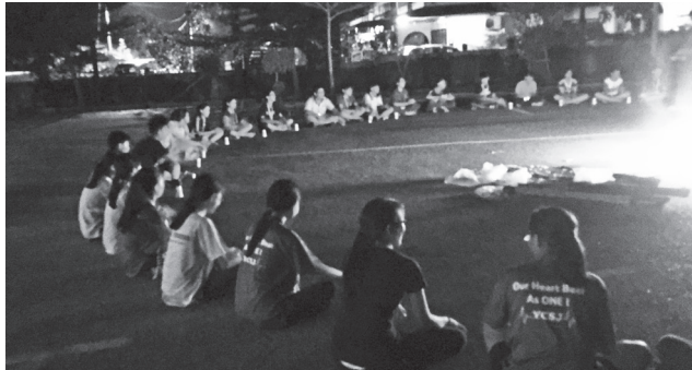
晚上的营火会，让大家印象深刻。