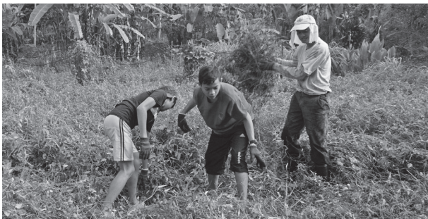
学生接触全然陌生的环境，学习新的知识，打开视野。