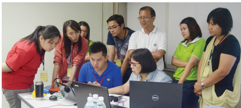
育才独中让教师参与多项培训，提高教学素质。