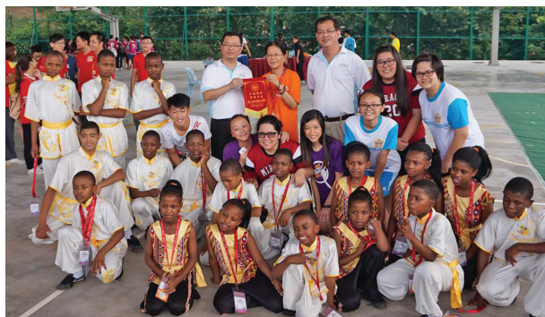
育才独中积极争取机会与来自世界各地的学校互动，图为本校学生与非洲莱索托圆通学校学生进行亚非文化交流活动。

本校经常与国内外的学生进行文化交流。如与台北市立大学教育系联办各种营会，两校学生一起学习；与来自非洲莱索托圆通学校的学生进行亚非文化交流活动；透过安排国际义工到校服务，促进与外国学生的交流与学习。