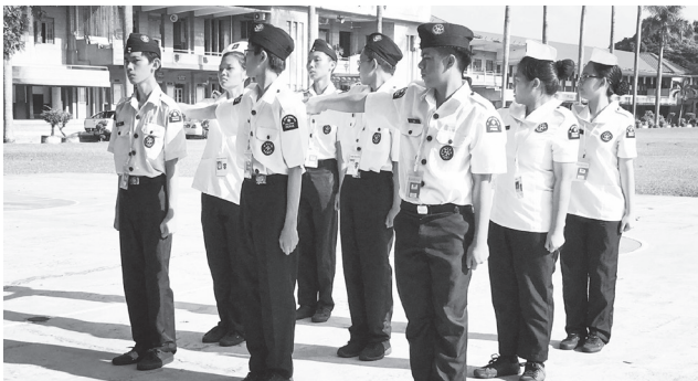
大家都一致认为此活动让操步的步伐更趋整齐。