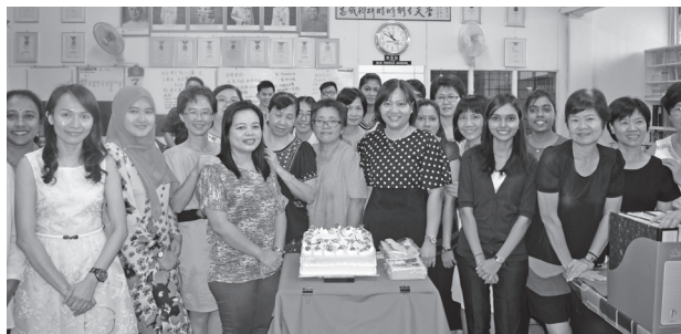
本校女教职员们切蛋糕庆祝国际妇女节。

3月8日国际妇女节是庆祝妇女在经济、政治和社会等领域做出的重要贡献和取得的巨大成就而设立的节日。本校教职员联谊会配合此节日的到来，当天举行了一个简单的庆祝仪式。