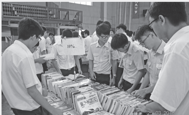
图书馆筹办书展，让同学们多接触各类书籍。