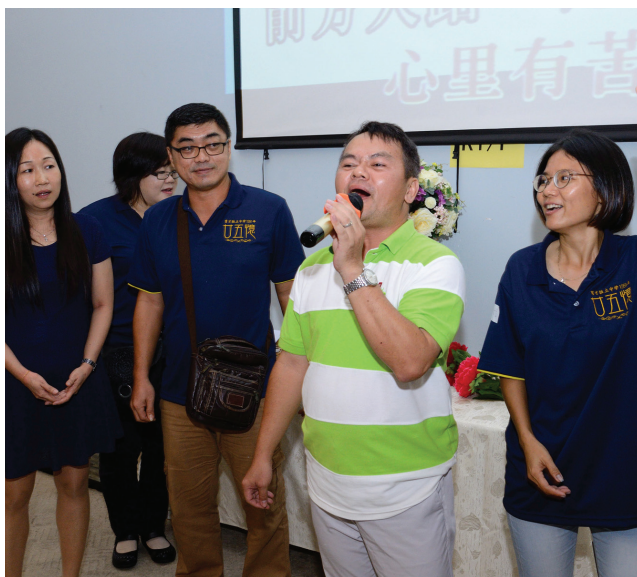
因多年不见而感到生疏的冷场面，并没有出现过。