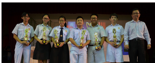
最佳逗哏 & 捧哏