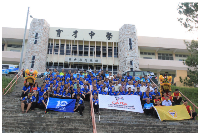
逾100名拉力赛车队队员在本校留影。