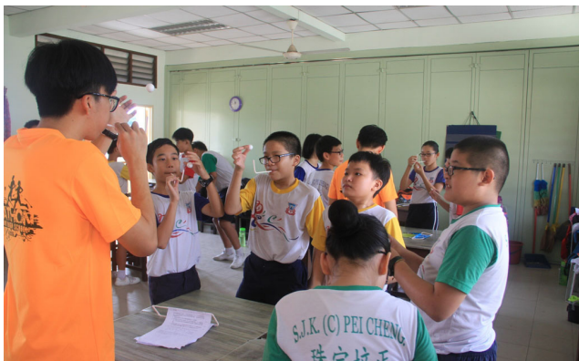
本校学生带领培正华小学生通过小游戏来了解科学原理。