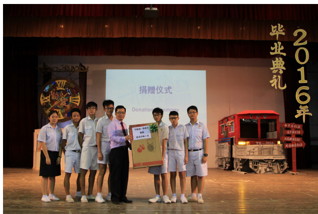
全体初中毕业班赠送流动音响。