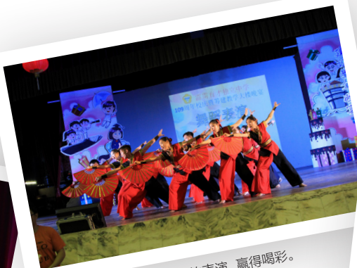
本校学生呈现精彩的表演，赢得喝彩。