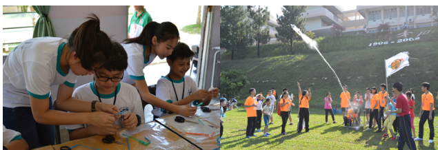
辅导员教导小学生们制作海马手工吸管。 辅导员与营员们共同发射“水火箭”。

营会的活动有手工吸管、环保肥皂、孔明灯、发射水火箭，也准备了一系列的科学实验如魔法袋袋、水中的蜡烛、再现指纹、水中奇景、超级冰块、氢气咻咻咻等让营员们大开眼界。