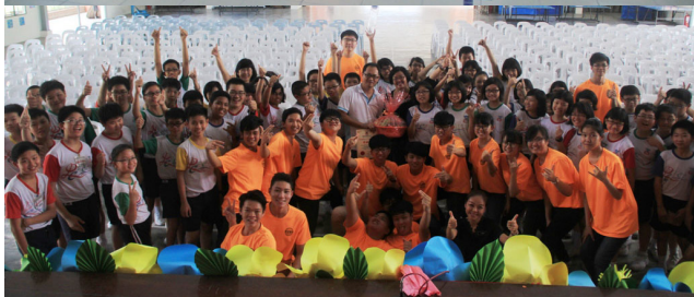
高二理班师生与培正华小师生在活动结束后大合照。