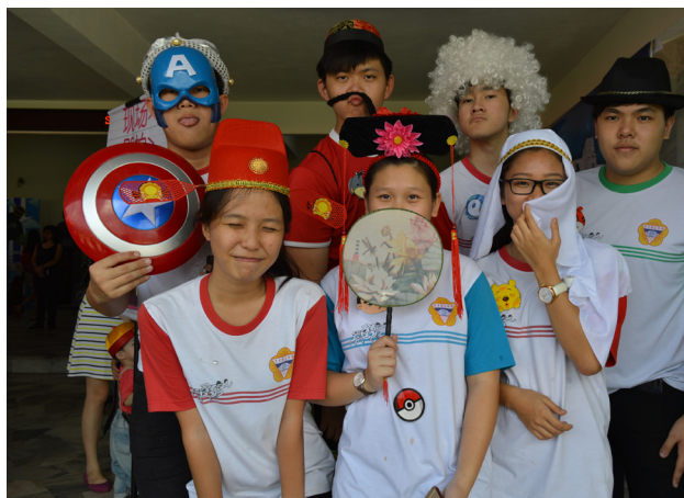
学生们高兴的拍下有趣的照片。

本校于8月3日举办年度义卖会，获得广大社会人士、家长和校友的支持，义卖会从上午8时开始就不断迎来人潮，人群穿梭在由师生、文教团体和热心商家所设立各类摊位前。