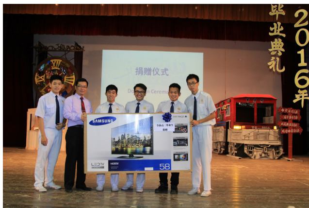
全体高中毕业班赠送58寸电视。