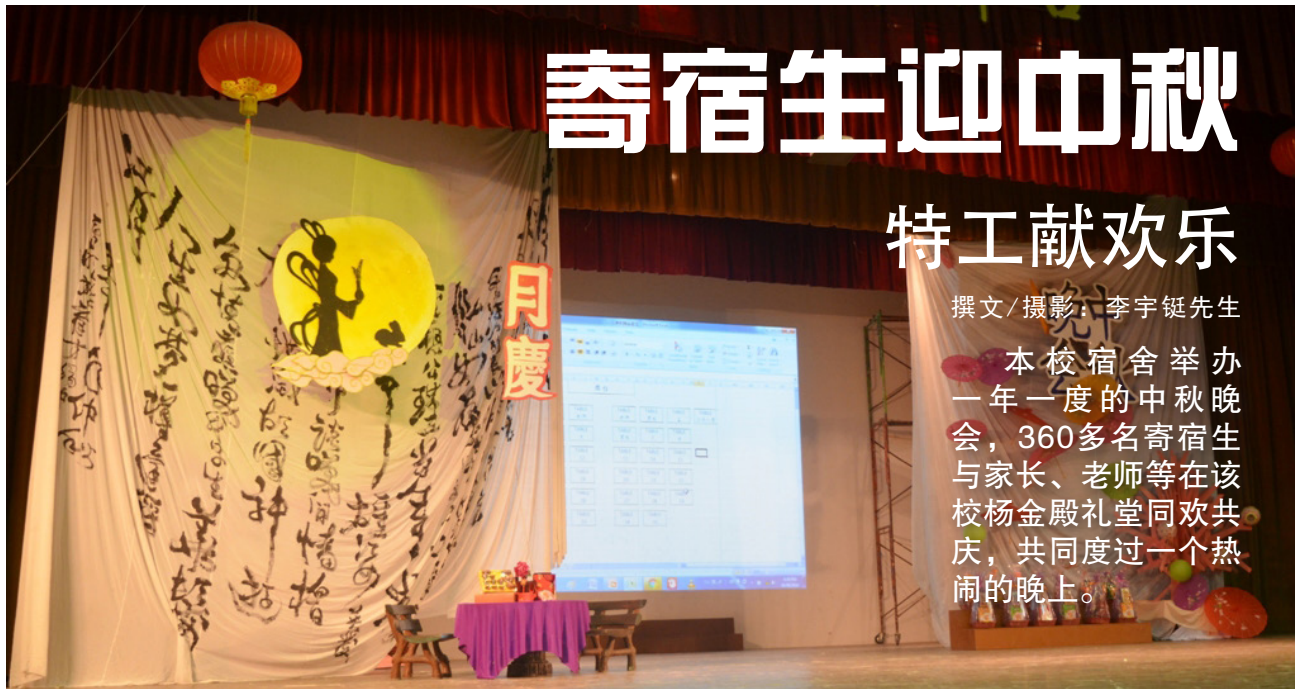
本校寄宿生布置出中秋气氛浓厚的舞台。

本校宿舍举办一年一度的中秋晚会，360多名寄宿生与家长、老师等在该校杨金殿礼堂同欢共庆，共同度过一个热闹的夜晚。