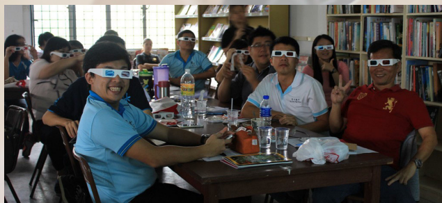
教师们带上3D镜片观察影像的变化。