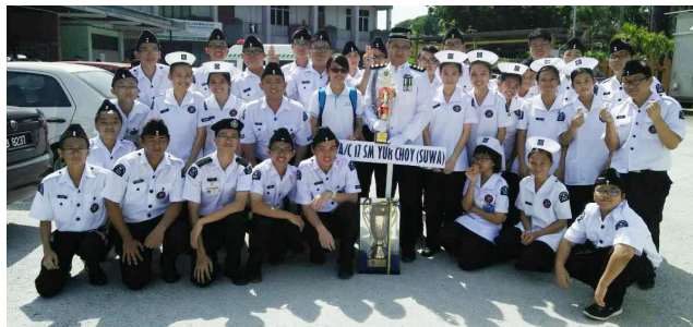
霹靂州中区的常年检阅礼和操步比赛，初中男子组荣获冠军。