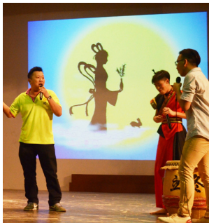
幸齐能老师(左)也被邀请上台参与游戏环节。