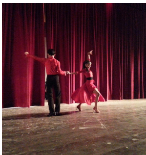
寄宿生呈献拉丁舞表演。

大会安排了多项表演作为娱兴节目，有拉丁舞、三大民族舞蹈、夜光扯铃、话剧、绕口令、抽奖等活动，让所有的出席者都提早度过了一个美好的中秋节。