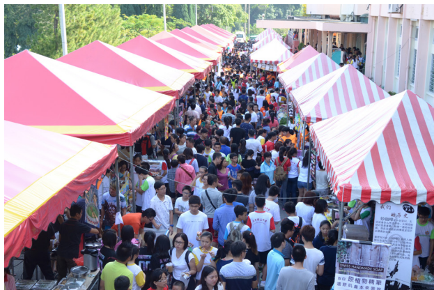
义卖会获得热烈支持，人潮络绎不绝。