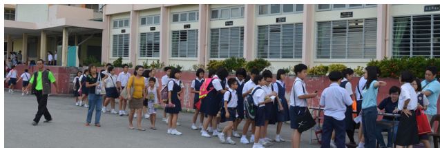
来自怡保各华小的学生陆陆续续到本校参加升学编班考试。

参加考试的小学生除了由家长亲自载送，也有部分是搭乘该校安排的专车到来应考。本校今天一共在市区及近郊安排了近20个候车点接送小学生赴考场。