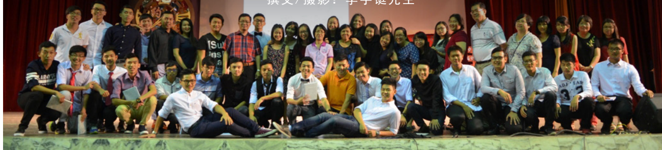
全体毕业的高三寄宿生大合照。

岁末，又到了离别的季节，本校宿舍也举办2016年宿舍惜别晚会，欢送2016年高三毕业的寄宿生。此外，本校初中第81届、高中第67届、文美班第23届、汽修班第24届毕业生为了感谢老师的教导，举办了一场谢师宴。