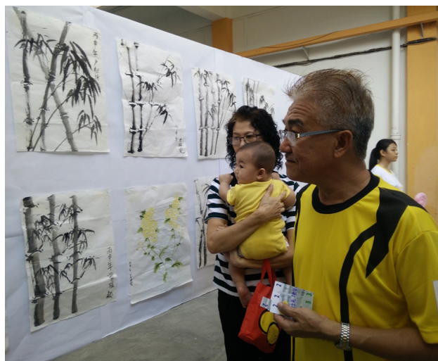
家长参观学生的习作。