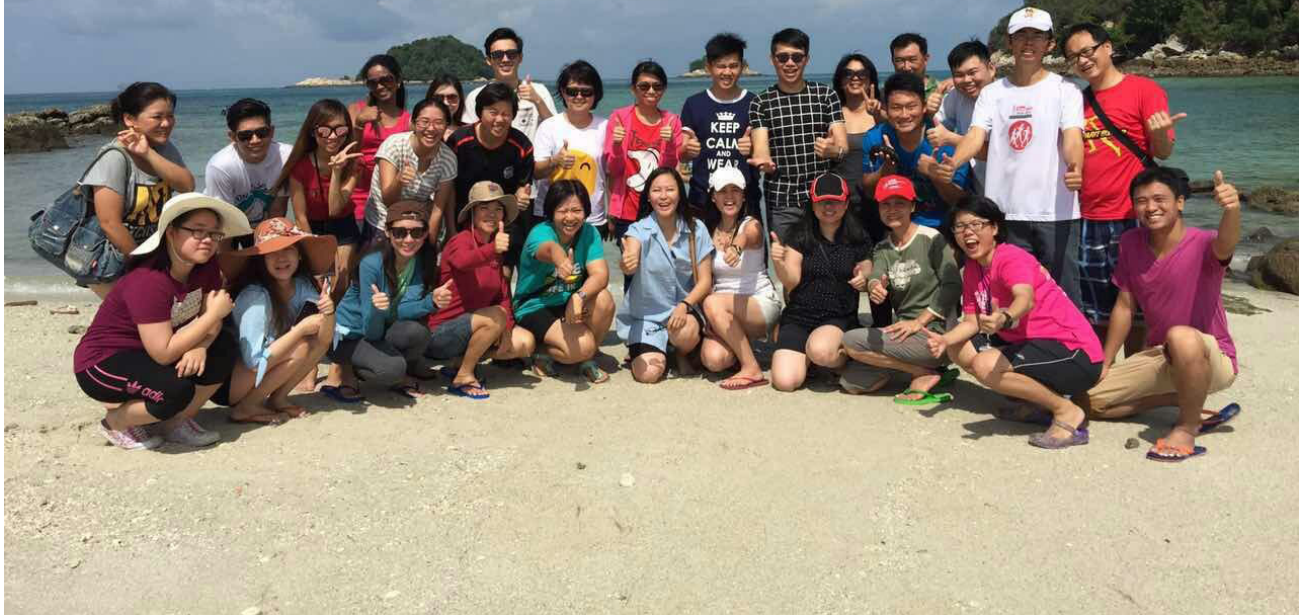
参与旅游活动的教职员在九屿岛欢乐合照。

本校教职员联谊会为全体教职员安排了年度旅游活动，目的地是九屿岛，在10月21日让教职员们能够放下手上的工作，到这个美丽的岛欢乐度假。