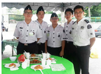
在烹饪比赛中，本校圣约翰救护队在初中男子组9支队伍中荣获亚军。