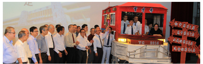
本校董事与毕业典礼筹委敲响毕业钟。

毕业典礼在毕业歌声《最珍贵的角落》下落幕。前来观礼的家长和朋友纷纷为毕业生送上鲜花和祝福，场面温馨感人。