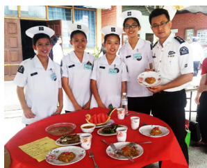
本校初中女子组在17支队伍中荣获烹饪比赛殿军。

在2016年8月7日，本校共派出两支队伍参加了由圣约翰救护队总部举办的全霹靂州烹饪比赛。在这次的比赛中，初中男子组在9支队伍中荣获亚军，而初中女子组在17支队伍中荣获第四名。他们在比赛前进行了1个多月的密集训练，除了每次学会活动时间都会进行练习，在家里也每天加紧练习，连双休日都回来学校进行练习。他们必须在2个小时之内完成4人份的食物，包括炒饭、青菜、蛋、鸡、汤和雕刻水果，同时要将食物摆设好，及收拾干净他们的用具。顾问老师们看着他们由不会烹饪到获取今天的成绩，知道他们都付出了一定的努力、耐心与毅力。从每次失败和挫折中学会爬起，学会接受批评，学会改进，学会进步，知道了要有收获必须先学会付出的道理。