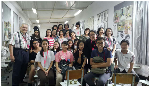
交流团参观上海闸北第八中学美术室。

除了参观美术学校外，该交流团也参观当地的名胜古迹，如城隍阁、西湖、苏州鸟巢、水乡古镇、东方明珠塔等等，让所有师生除了对中国有更深的认识外，也大开眼界。