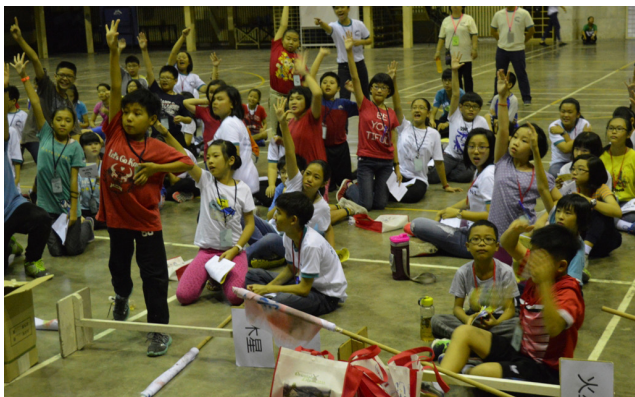
全体营员们投入在团康游戏环节里。