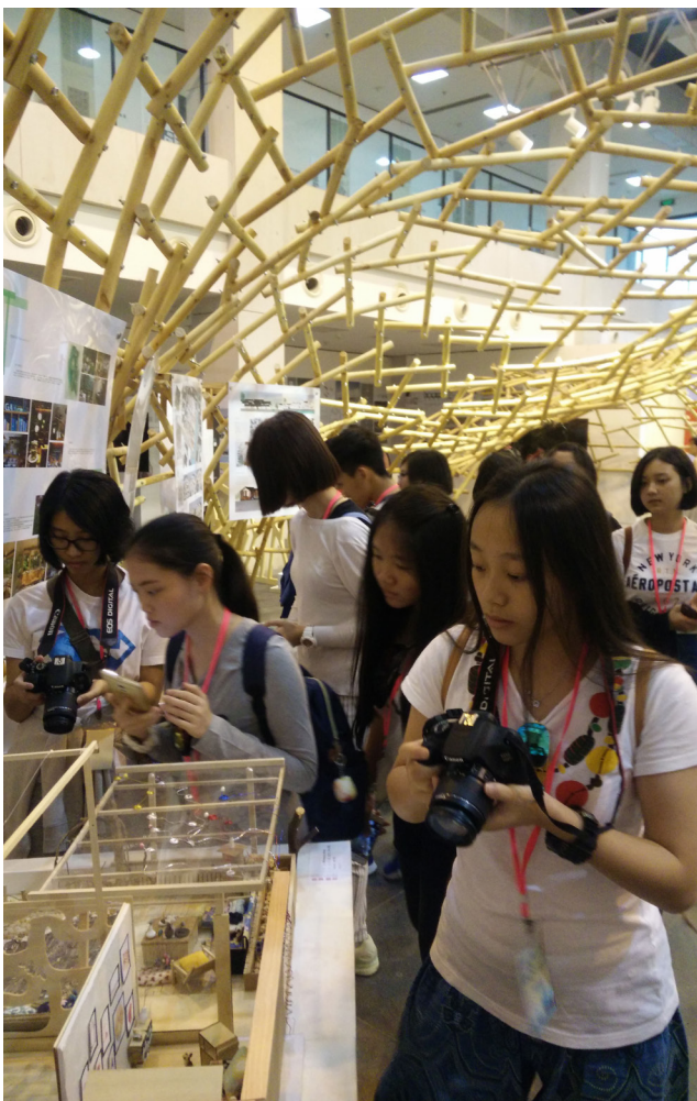
学生参观美术作品。