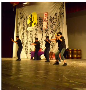
寄宿生打扮成特工呈献舞蹈表演。