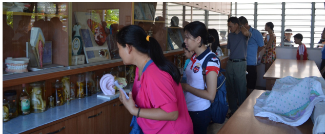
家长们参观本校的设备。