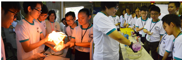
辅导员展示科学实验给营员们观看，并讲解其中的科学原理。