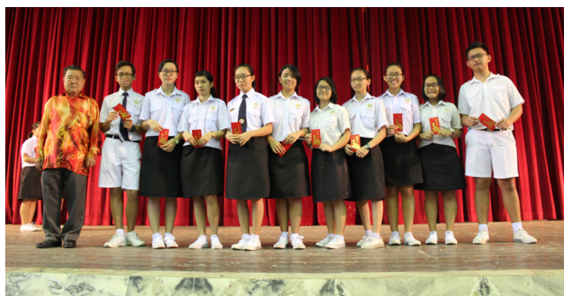
乙组（初中三、初中二）