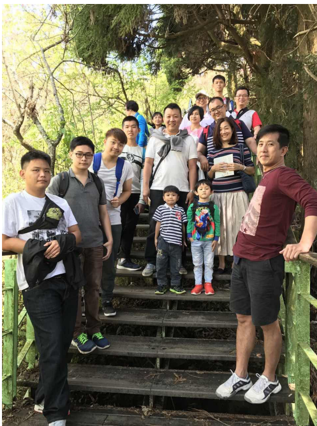
师生们到各名胜景点参观。