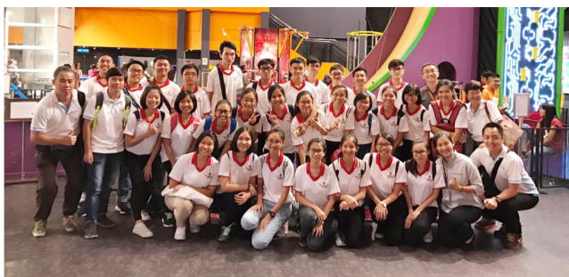
本校师生参观槟城圆顶科学馆。