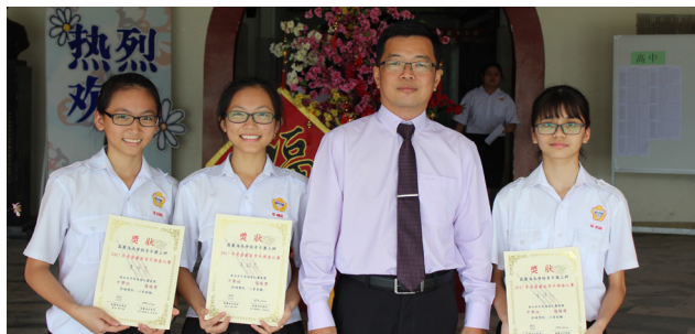
霹雳海南会馆青年团主办2017年霹雳区常年挥春比赛 中学组优胜奖