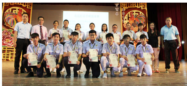
北近打县学联篮球锦标赛