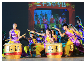
廿四节令鼓的表演气势磅礴。