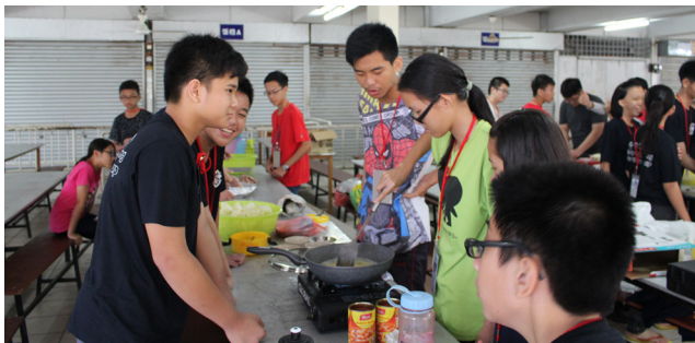
烹饪是充满挑战的环节。