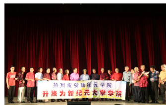
本校恭贺新纪元升格为大学学院。