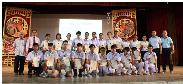
北近打县学联排球锦标赛