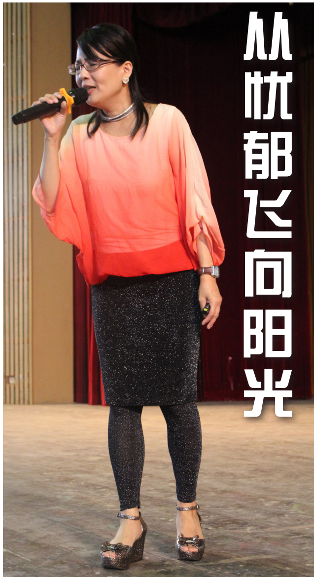
身为歌手的何方，在讲座上为大家献唱两首歌曲。

来自台湾的电台暨电视节目主持人何方于4月7日在本校进行一项名为“从忧郁飞向阳光”讲座，与该校师生探讨忧郁症及自杀的课题，获得该校师生热烈欢迎。