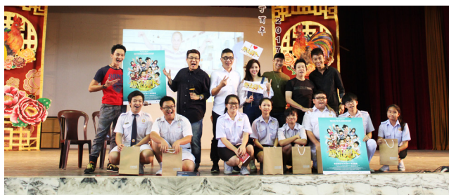
比长气游戏结束，上台参与的同学获得礼物一份。

本校联课活动处于3月3日在杨金殿礼堂举行《遇见贵人 Take 2》电影分享会。新加坡著名演员兼导演梁志强以监制的身份带领电影《遇见贵人 Take 2》夏友庆导演、演员廖永谊、林俊良、邓晴冰和程旭辉到本校进行电影分享交流会。