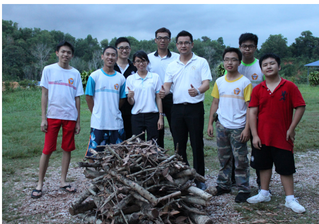
营员在进行营火会的准备工作。