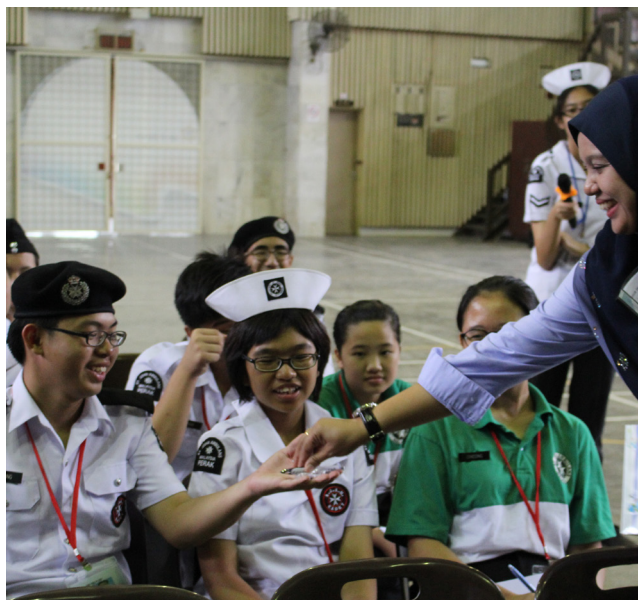
营员参与反毒意识讲座。

学会在一个来自不同学校的团队中是需要互相迁就，不分你我，不怕辛苦，才能够取得成功。感谢队官、老师、委员和营员们的配合，让营会增添不少乐趣。