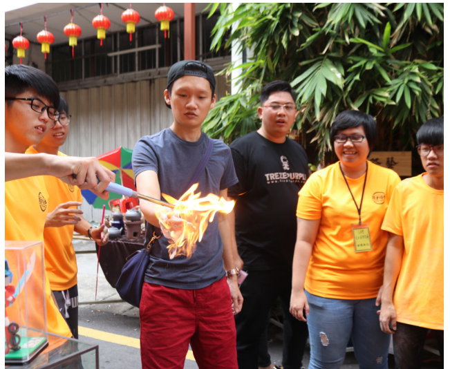
大胆的让火在手掌上燃烧后，会发现这其实一点都不可怕。