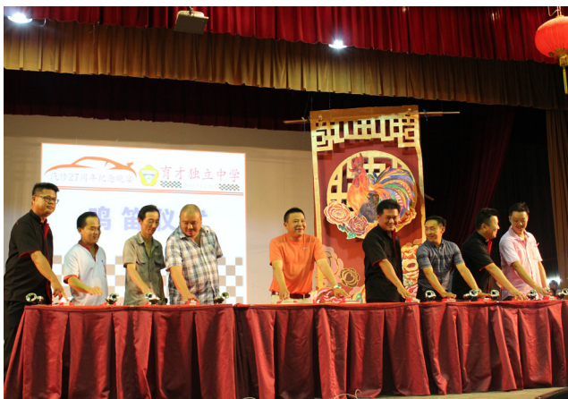
赞助人在台上进行鸣笛仪式。