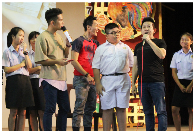
演员们和学生在台上玩游戏互动。