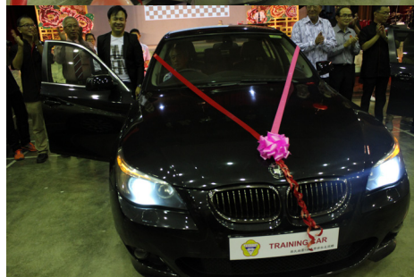
3位校友捐赠3辆轿车，在台前进行启动实习训练汽车及亮灯仪式。