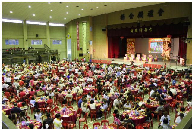
本校丁酉年新春晚宴筵开约120席。

工委会也安排了多项表演，如武术、舞龙、华乐、廿四节令鼓、如拉丁舞、民族舞蹈等表演，让出席的热心华教人士尽兴而归。