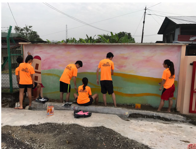
本校学生顶着大太阳为双溪里武华文小学添一幅壁画。