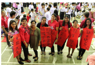
友族教师也一同参与写挥春的行列。