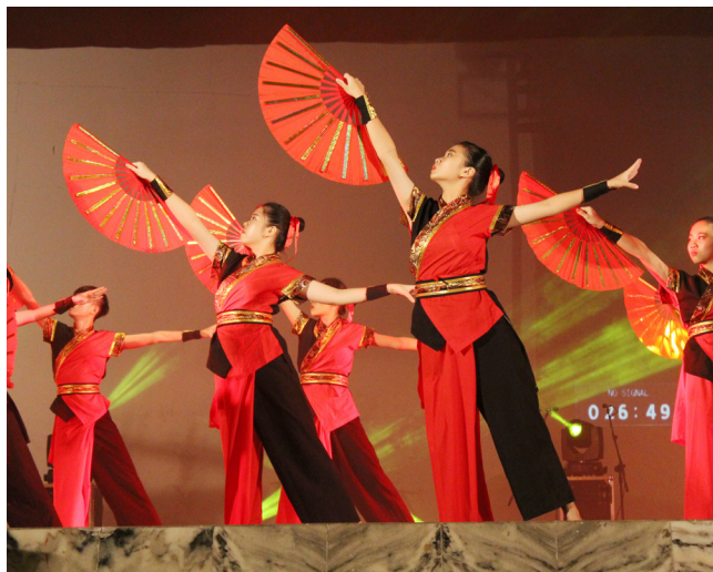
本校舞蹈团成员也参与演出。