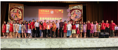
嘉宾与教师们合影。