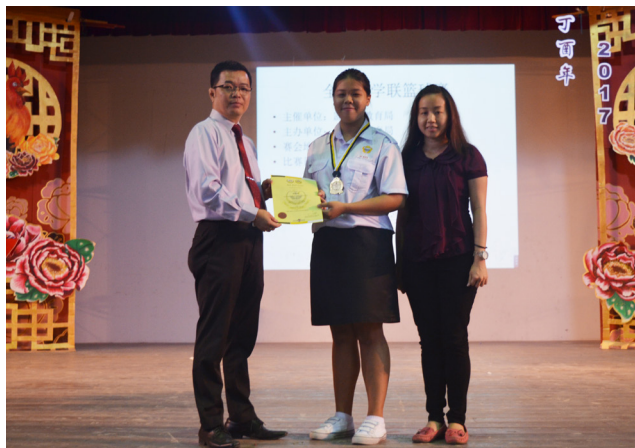
霹雳学联篮球锦标赛