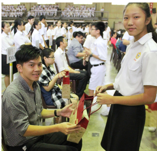
学生把余仁生“春节谢师恩”保健礼袋送给老师，感谢老师的辛劳付出。