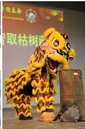
醒狮表演《智取枯树藏宝》。