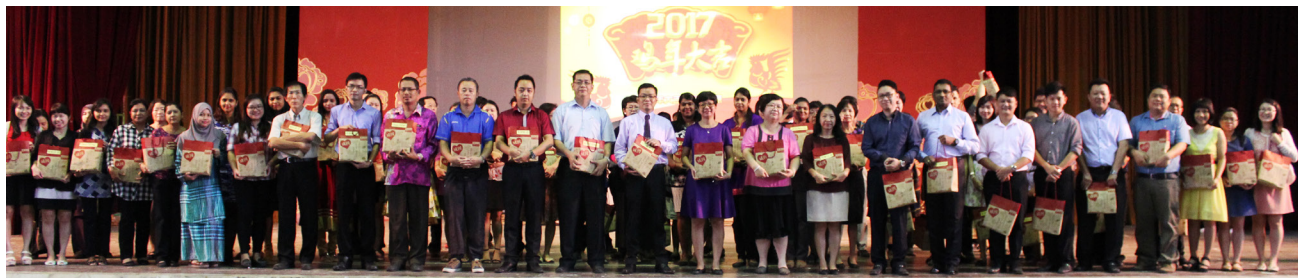
全体教职员在领取余仁生礼袋后上台拍大合照。

本校全体教职员分别于1月18日及23日获得教职员联谊会及余仁生私人有限公司派送新春礼袋，为丁酉鸡年的到来增添喜庆气氛。