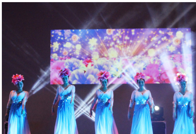
天津滨海浪花艺术团呈现完美的演出。