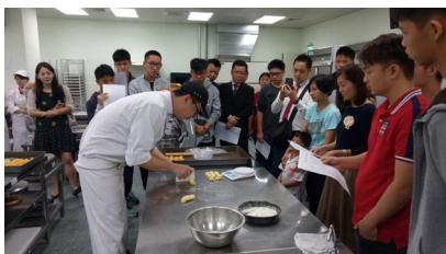
参访台湾大学，让学生从开拓视野。