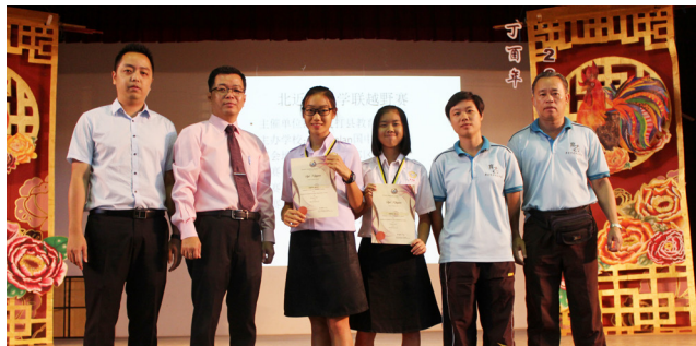
北近打县学联越野赛