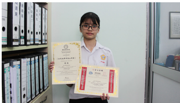
丁酉年墨舞富山全国挥春赛中学组佳作奖 金凤翔舞挥春公开赛优等奖