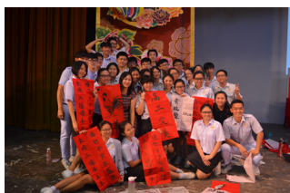
书写完毕，高三文美学生开心合影。