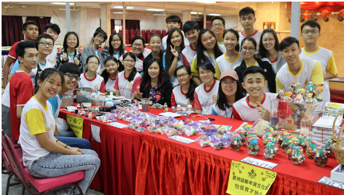
文美班老师及学生为筹募美术展经费而努力。

为了筹募美术展经费，本校文美班于1月13日至1月15日，在怡保斗母宫举办的星洲日报新春庙会活动设摊摆卖手工艺品。