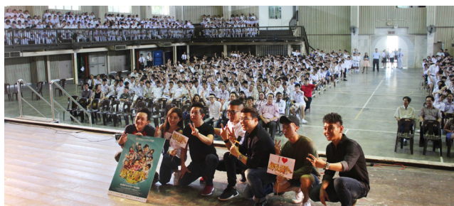
《遇见贵人Take 2》获得师生热烈支持。

《遇见贵人Take 2》是一部以囚犯出狱后重新做人概念的喜剧，故事重点围绕在他们要如何适应出狱后的新生活，以及遇到一位贵人后所发生的事。