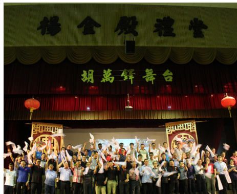
热心的赞助人上台挥旗。

他感谢三大机构、校友和各界人士在经济不景气的时刻仍然积极捐款，协助提升设备和让学生搬迁至更广阔和舒适环境学习。