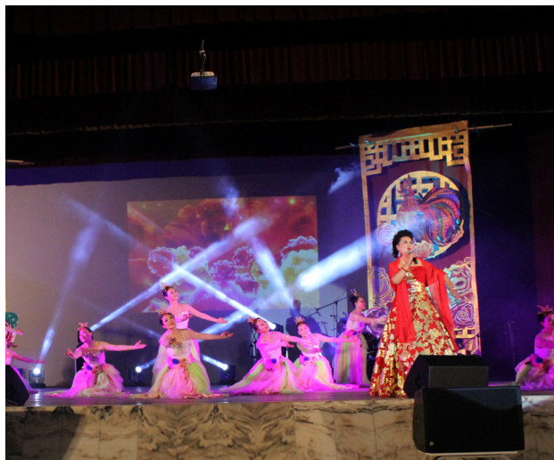
优美的歌声和表演，丰富观众的听觉与视觉。