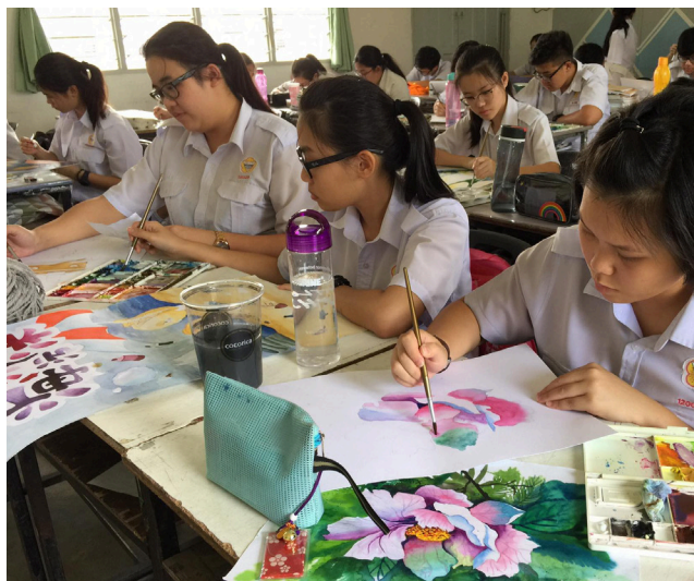
学生在班上认真作画。