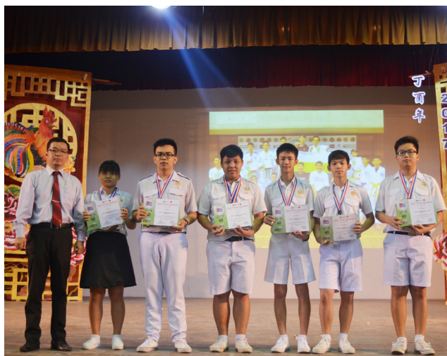
全国跆拳道锦标赛