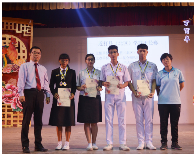
北近打县学联田径锦标赛