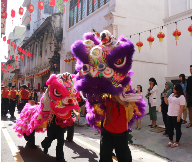
龙狮团在三奶巷舞狮，带出浓厚新年气氛。