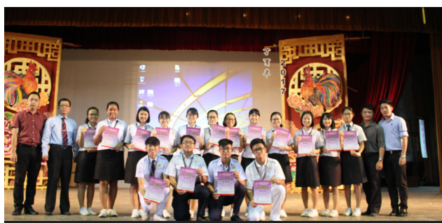
红卍字杯全国节令鼓观摩邀请赛