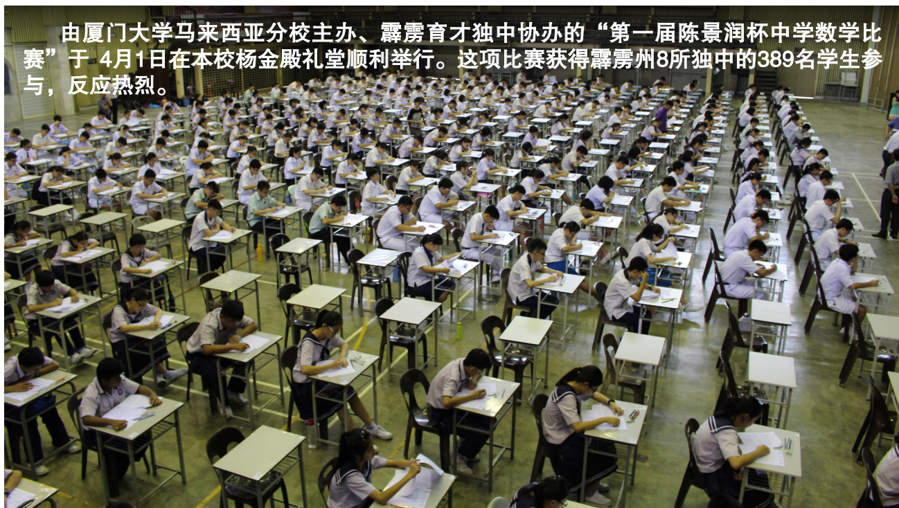
共多达389名来自霹雳州8所独中的学生报名参加陈景润杯中学数学比赛。

由厦门大学马来西亚分校主办、霹雳育才独中协办的“第一届陈景润杯中学数学比赛”于4月1日在本校杨金殿礼堂顺利举行。这项比赛获得霹雳州8所独中的389名学生参与，反应热烈。