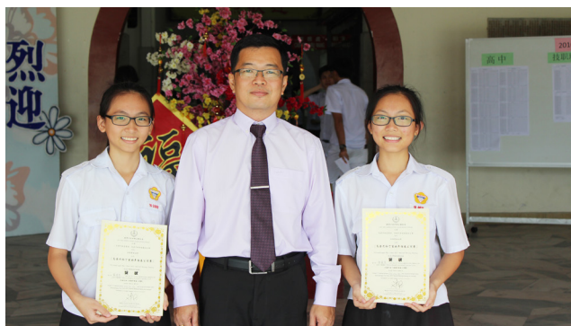
霹雳州非伊斯兰事务局主催马登巴冷 丁酉鸡年挥春公开赛 中学组优胜奖