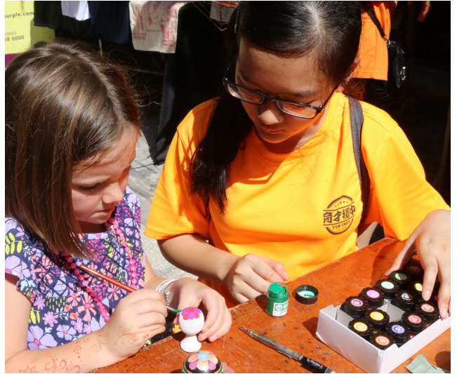
文美班学生进行“木偶彩绘”指导。