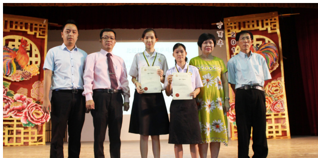
近打北区学联乒乓球赛