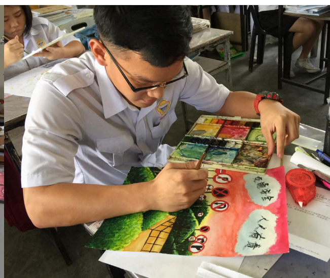
学生用心学习，打稳基础。