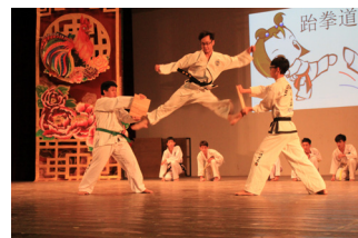
跆拳道教练表演飞踢木板动作，令人看得目不转睛。