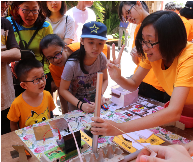
龙狮团在三奶巷舞狮，带出浓厚新年气氛。