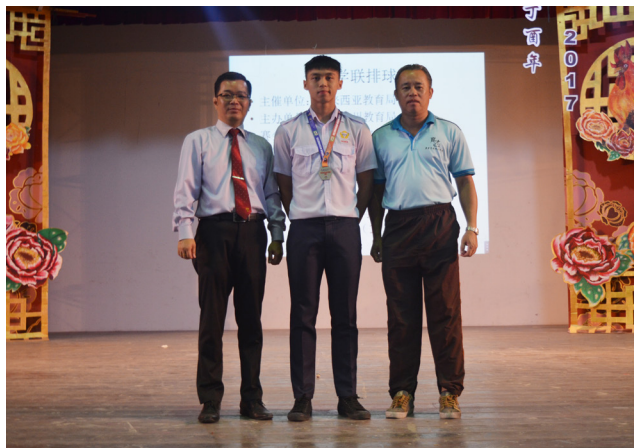
全国学联排球锦标赛