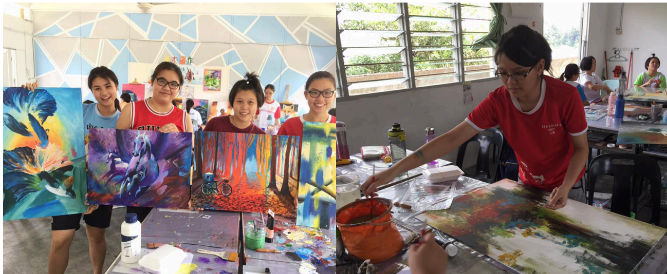
高三文美学生在学校假期也不忘学习用压力作画。