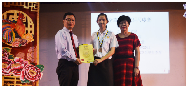
霹雳学联(MSSPK)乒乓锦标赛