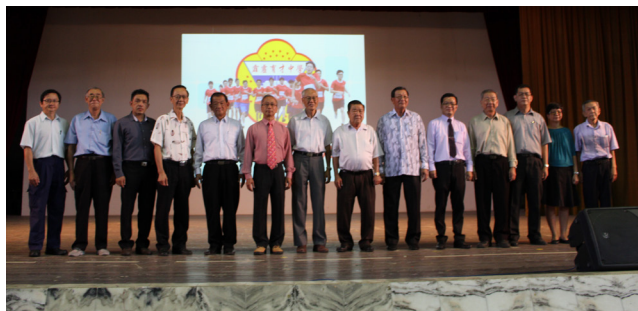
董事们为110周年校庆活动进行揭幕礼。

始业典礼的尾声，是本校110周年校庆活动揭幕礼，由黄亚珠董事长主持，他宣布本校将会进行一系列活动，有：梁琬清教学楼落成开幕、蔡任平讲堂设备提升、提升多元用途篮球场、搬迁与提升汽车维修实习厂、天津滨海浪花艺术团义演、华教先贤精神演讲、美术与书法展、育才讲堂/教育讲座、教师节感恩晚宴、校庆义跑公开赛、义卖会、校友回校日、教学成果展、学术与教育研讨会、110校庆联欢宴会等。