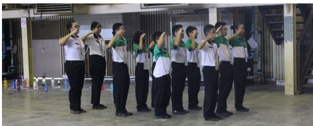
营员们进行操步训练。

他强调，身为圣约翰救伤队队员，必须要谨记要饮水思源，“一天是圣约翰救伤队队员，终生是圣约翰救伤队队员，我们要无时无刻提供最热诚的支援予大众。”