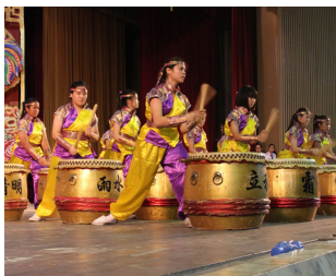
廿四节令鼓团呈现《金鼓齐鸣庆鸡年》。