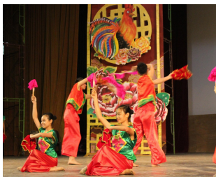
舞蹈团学员呈现轻快又欢乐舞蹈《音韵》。