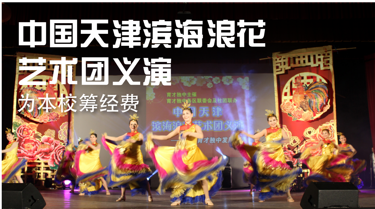
轻快又热情的开场舞《盛世欢歌》带起气氛。

由本校主催，32个各区联委会及团体联办的中国天津滨海浪花艺术团义演，于4月18日在本校杨金殿礼堂圆满举办，来自中国天津的滨海浪花艺术团祝贺育才踏入110周年，也替本校筹募经费。