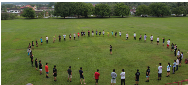
全体营员在草场进行团康活动。