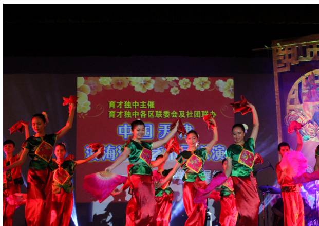
本校舞蹈团成员呈现富中华民族风情的舞蹈。