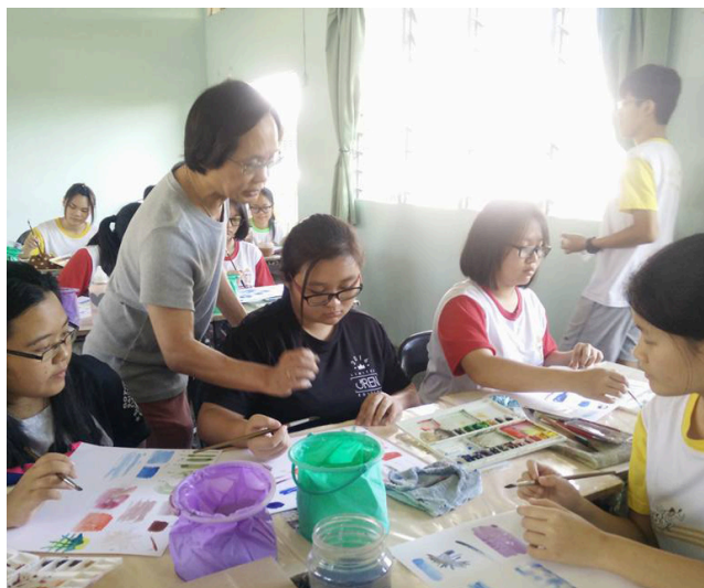
高一文美学生也为美术展做准备。