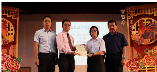
北近打县学联羽球锦标赛