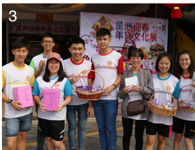
1: 文美班学生也化身老师，教小孩为木偶上色。