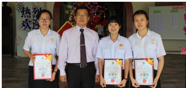
日善社文化会主办全霹雳《清流》文章读后感 优秀奖