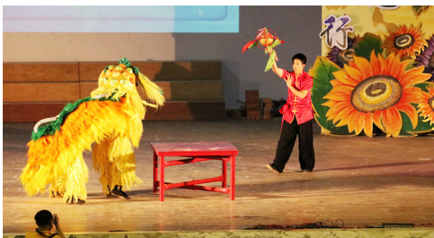
校外团体也通过表演庆祝育才创校110周年。