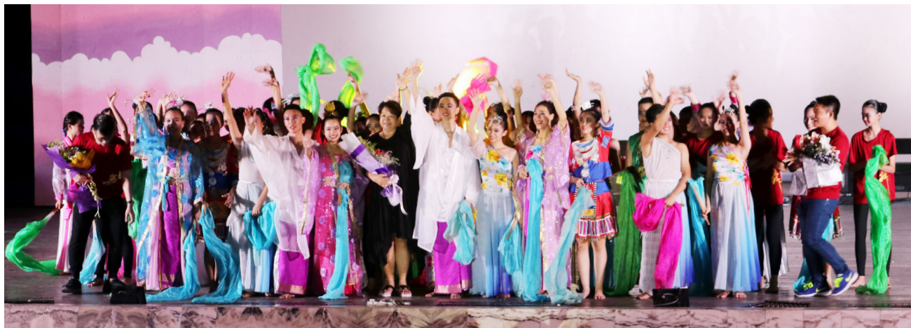
舞展指导老师及表演者上台向观众挥手致谢。

本校舞蹈工作群于11月18日晚上7时在杨金殿礼堂盛大举办“悦·季”舞展，呈献11支各种风格的舞蹈，有中华各民族传统舞蹈、朝鲜传统舞蹈、现代华族舞蹈等。