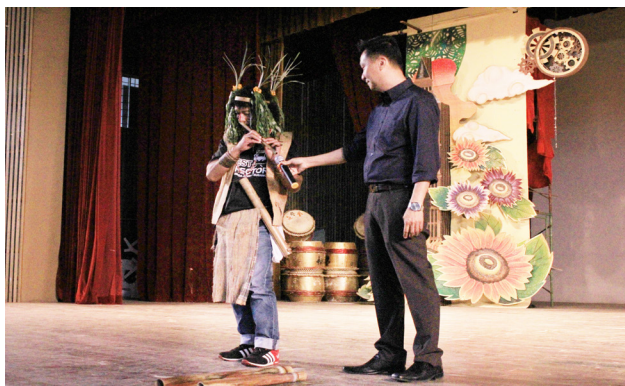
演员之一的原住民现场吹奏原住民曲子。

原住民在马来西亚已经日渐越少，导演廖文耀借着这次的机会，向大众宣传他们的文化。借此，导演廖文耀在受访时也提到，希望能够透过这次的分享会，让本校学生不要为了一时的时尚而跟风，忽略了身边的事物。潮流虽为重要，但自身的文化更为重要。