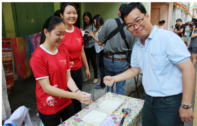
学生们设计的科学游戏吸引校长进行体验。

创意市集由本校约150位师生共同筹划，展示摊位超过20个，呈现的内容包括科学实验如火焰掌、超级大泡泡、钉床、空气炮等，还有各种创意手工如星