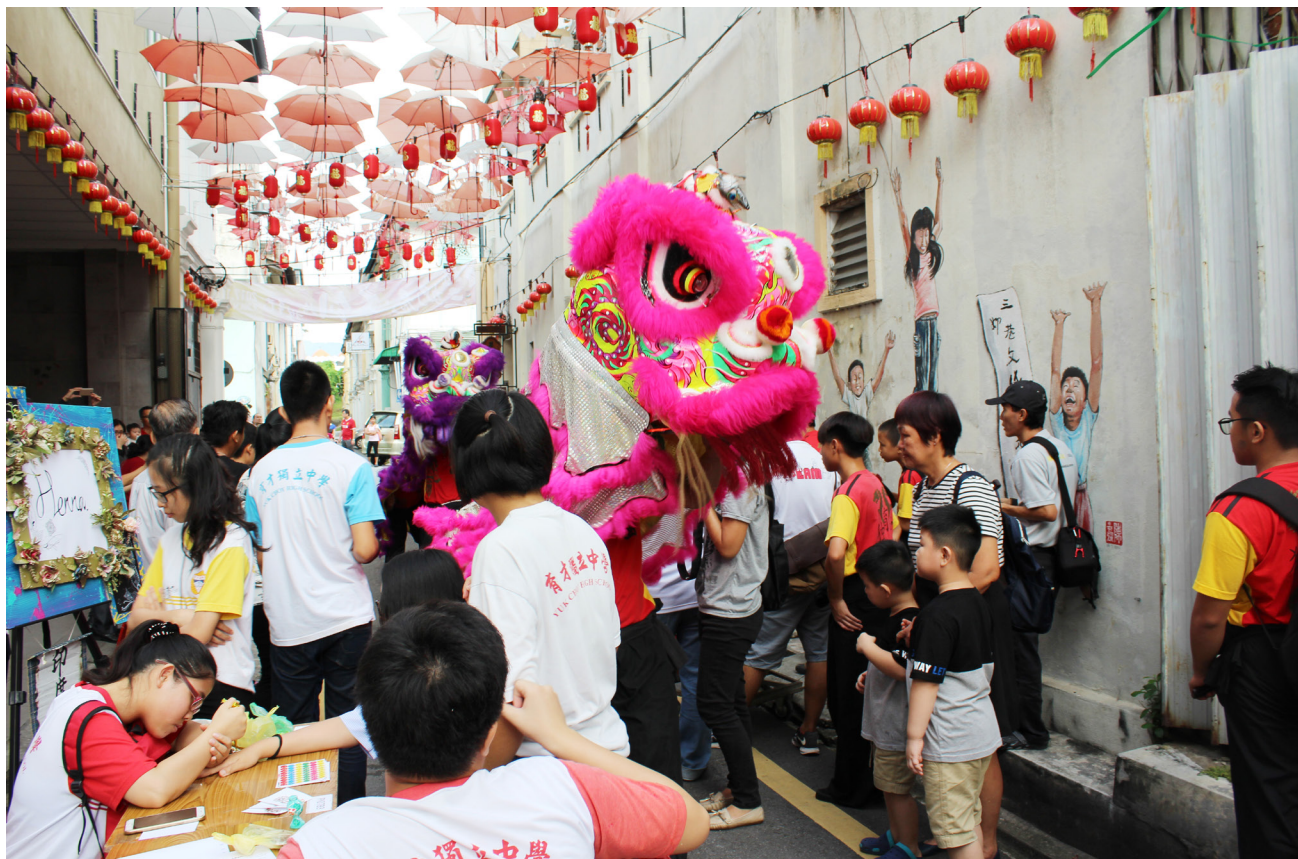
由本校师生们携手筹划的市集活动吸引许多人前来。

由本校师生携手筹划，集合创意手工、科学实验、传统童玩、表演等市集活动——《穿梭三奶巷·文创跨世纪》于11月19日在怡保旧街场三奶巷盛大举行，掀起热闹气氛。