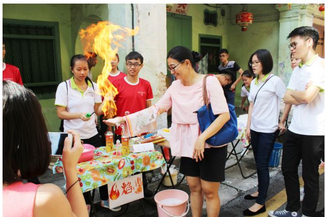
理科班学生准备“火焰掌”活动欢迎挑战者。

负责老师古景遥老师透露，学生们将科学实验与手创元素纳入每一个档口中，让学生们借着所提供的平台，通过课堂里学过的知识，加上创意思维，发挥个人的才华。