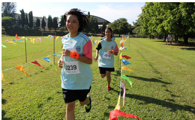
学生努力朝终点奔跑。

他也表示，该校近年落实了几项大的硬体设备和建设课程，包括多元用途体育中心、梁琬清教学楼、新的汽修实习工厂、装修蔡任平讲堂等，同时也不忽视软体的提升与建设。他表示学校多年来与中国上海闸北八中合作，推行成功教育，派教师参加新纪元大学学院教育系的教师专业文凭课程，把师资提升放在非常重要的位置。