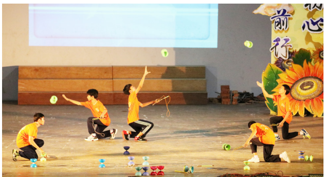
学生聚精会神进行扯铃表演。