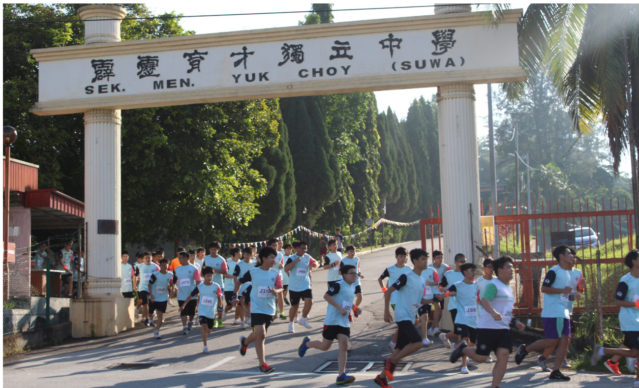
男子组需完成5.5公里路程，女子组和教职员组是4.5公里路程。