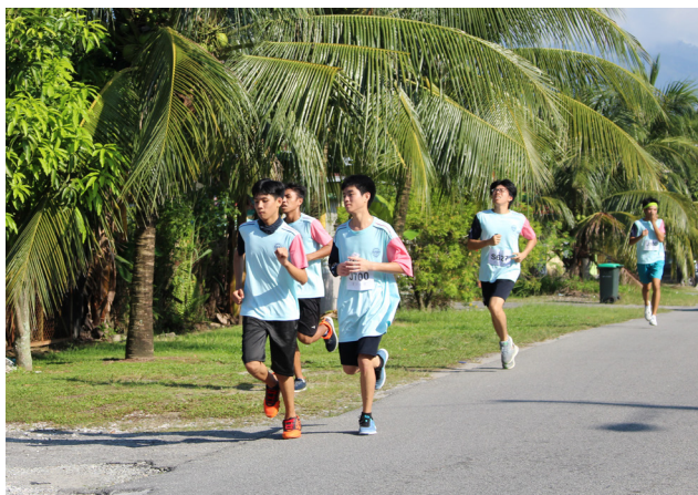
学生们慢跑时享受马来甘榜早晨清新的空气。