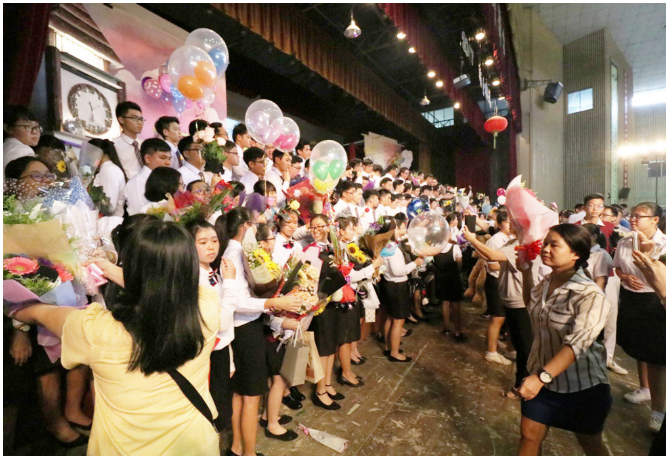
毕业生们在台上接受家长及朋友们献上的花束与祝福。

毕业钟声响起，又到了毕业的季节。本校于11月23日举办初中第82届、高中第68届、文美班第24届及汽车维修班第25届毕业典礼，获得全体毕业生亲朋好友前来祝贺，场面温馨感人。