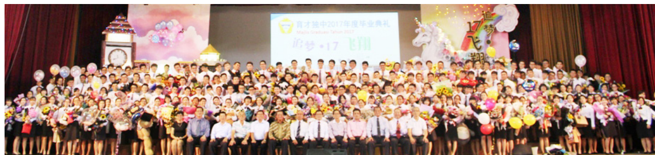
全体毕业生与董事在杨金殿礼堂拍下合照。