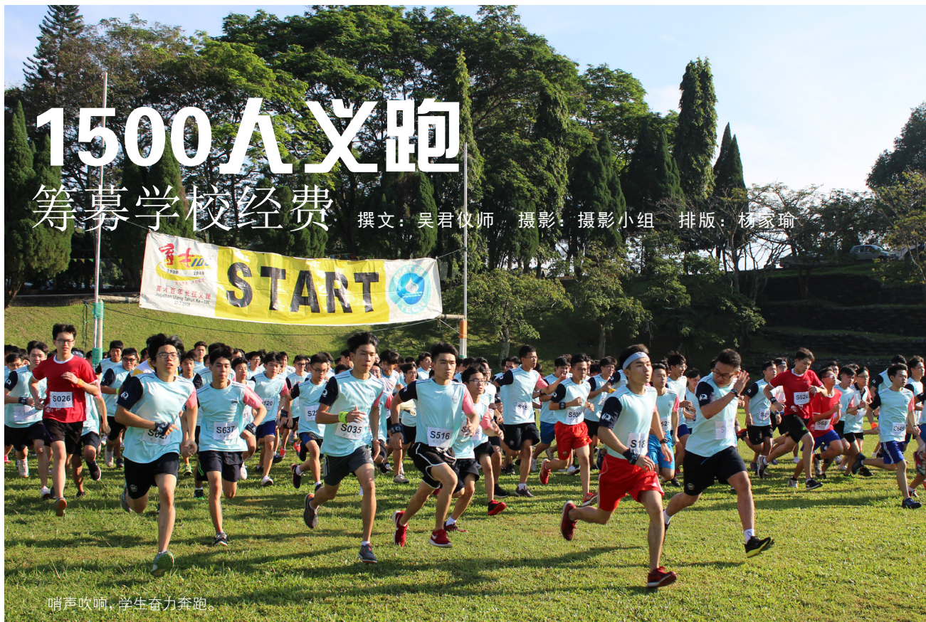
哨声吹响，学生奋力奔跑。