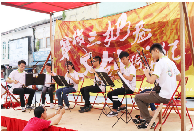
华乐表演增添热闹气氛。