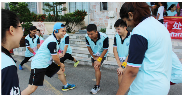
教师们义跑开始前进行热身运动。