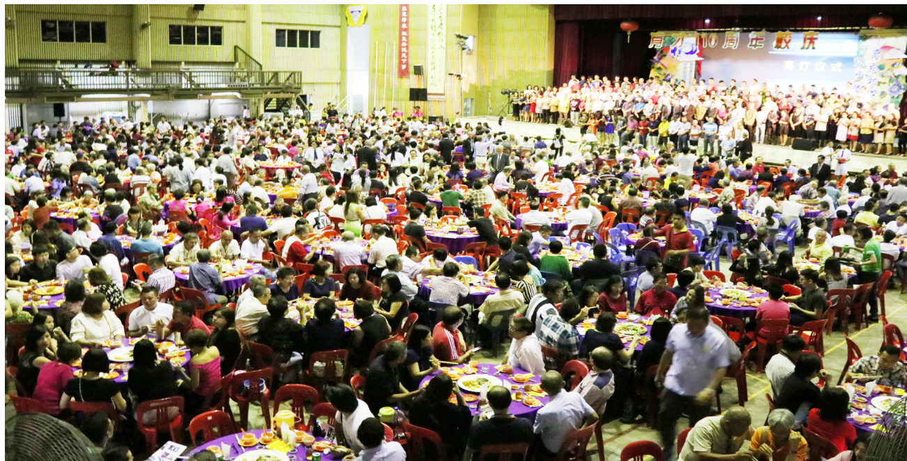
育才110周年校庆晚宴筵开150余席，场面隆重壮观。

本校于2017年11月11日在杨金殿礼堂，举行育才110周年校庆晚宴，以筹募建设汽车维修实习厂，及提升宿舍设备的基金。