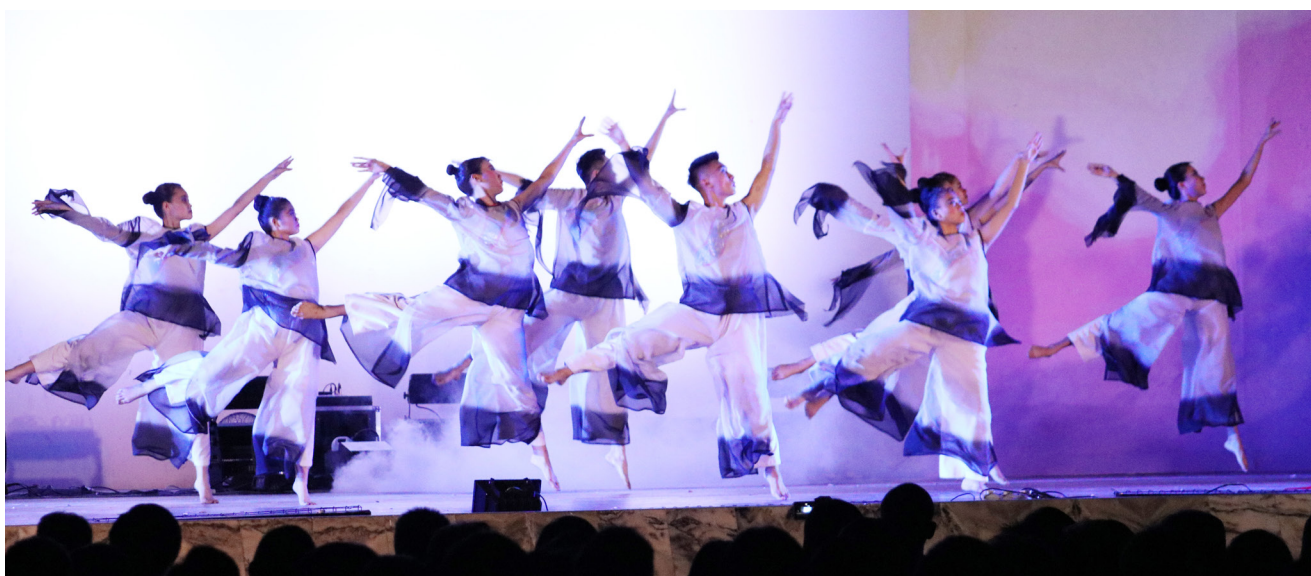
舞蹈员在台上时而轻盈，时而迅捷，时而张扬，令观众享受其中。