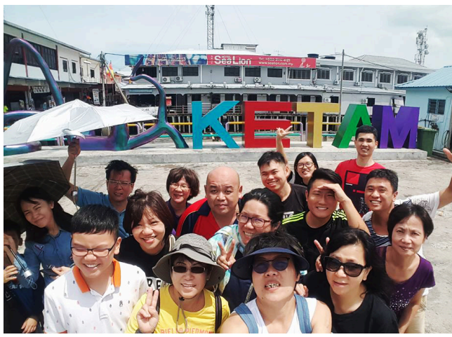
本教职员们一起到瓜拉雪兰莪和吉胆岛游玩，放松心情。