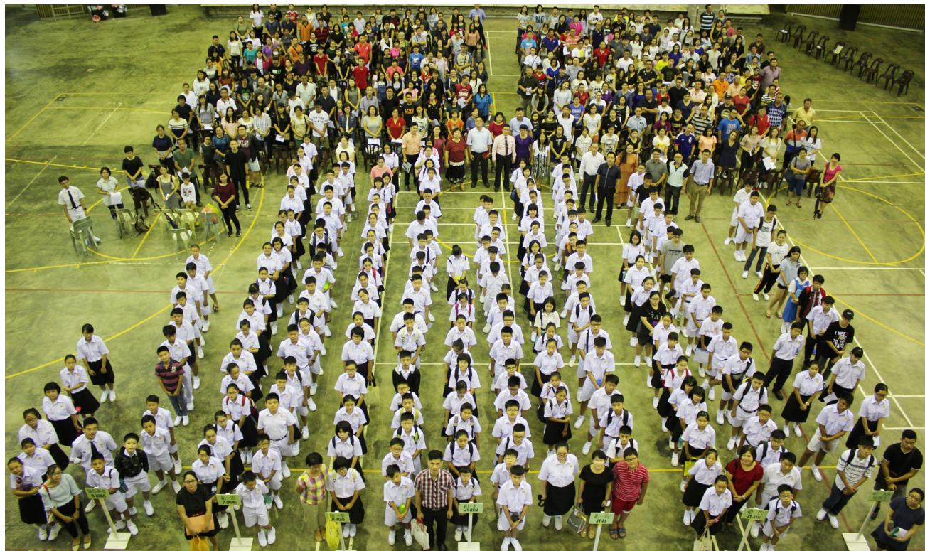
新生与家长到本校出席新生说明会。

本校于12月30日在杨金殿礼堂举行2018年新生入学说明会，让初中一的新生在上学前互相认识及熟悉新环境，也让家长了解该校的办学方针及各方面的发展。出席说明会的新生有220名，家长则有250名，反应热烈。