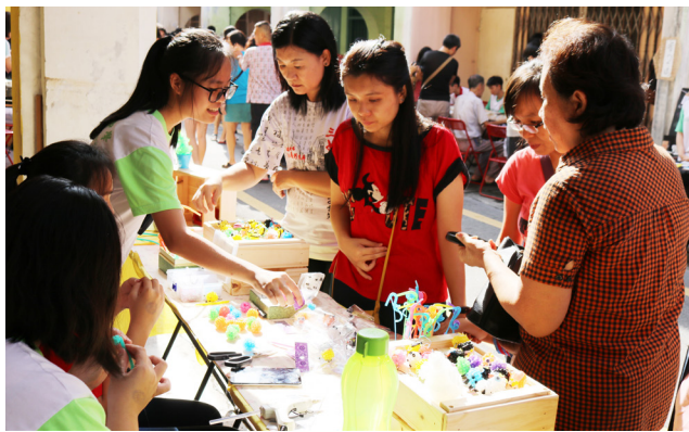
游客对学生制作的卡通吸管手作品深感兴趣。

空瓶子、动物吸管、手工香皂、传统梭织布、热缩片锁匙圈（魔法DIY）、叶脉书签、毛线玩偶、毛线绕框垫布、印度手绘等。此外，当天也有童玩游戏，以及本校华乐团、管乐团和龙狮团的表演，吸引了不少群众。